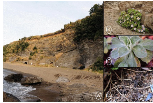
Fig. 1. Photographs of habitat of Aster spathulifolius Maxim. and characteristics of the plant (A: habitat, B: flower, C: leaf, D: root).

효모를 순수분리 후 (주)마크로젠(Seoul, Korea)에 의뢰하여 균주의 ITS sequencing을 (Kim and Kim, 2015a, b), 유럽생물정보학연구소(EMBL-EBI)의 웹사이트에서 다중서열 정렬 프로그램인 Clustal Omega ( www.ebi.ac.uk/Tools/msa/clustalo )로 multiple sequence alignment를 수행하였다. 계통도는 MEGA 5.2 (Tamura et al. , 2011)의 neighbor-joining method (Saitou and Nei, 1987)와 UPGMA method를 이용하여 완성하였으며, 균주의 염기서열 정보를 DDBJ/EMBL/GenBank에 등록하여 Accession numbers (LC331135~LC331251, 117 entries)를 부여받았다.