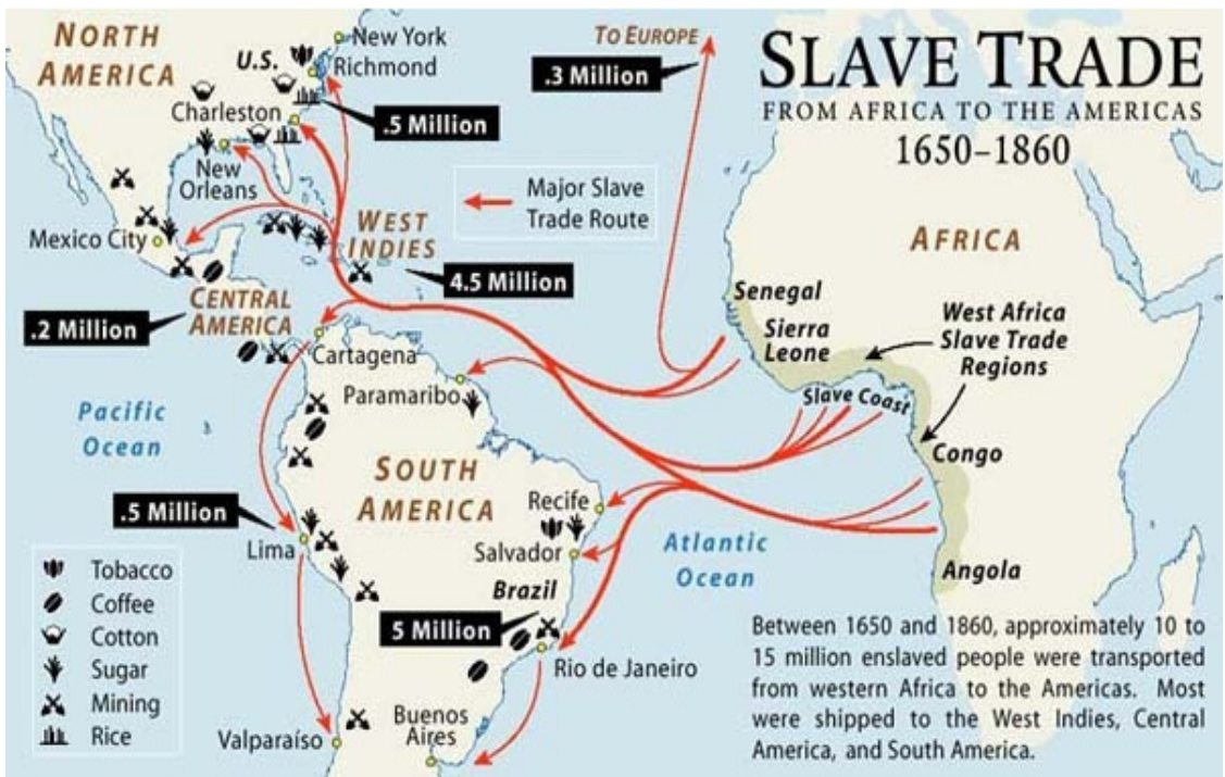
Fig. 1. The route of slavery force and the related industries during 1650 ~ 1860 in Africa

Fig. 1은 이 상황을 보다 자세히 설명해준다. 기존의 아프리카 노예무역은 유럽으로의 유입 위주로 행해져왔다. 약 30만 명의 아프리카 노예들이 유럽으로 유입되었다. 하지만 스페인과 포르투갈을 비롯해 프랑스 영국 등 식민지를 소유한 국가들이 거대한 영토와 비옥한 토질이 많은 서인도제도와 브라질을 필두로 한 아메리카 대륙 곳곳에 유럽에서 비싸게 취급되는 작물인 설탕, 담배, 커피 등의 기호식품과 작물들을 계획 재배하면서 아프리카 노예들은 인구가 감소한 서인도제도와 브라질 사람들의 빈자리를 채우기 위해 이들 지역으로 향하게 된다. Fig. 1.은 브라질 지역의 광산과 커피 생산을 위해 약 500만 명의 노예가 아프리카에서 수급되었으며 서인도제도에서의 자원과 설탕 등의 생산을 위해 450만 명의 노예가 아프리카의 노예 해안(slave coast)으로부터 유입되었음을 자세히 보여주고 있다.