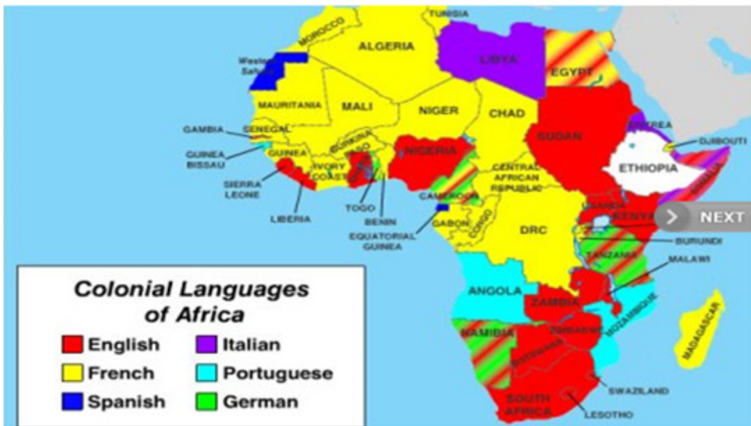
Fig. 3. Colonial languages of Africa[7]

그 이유는 무엇인가? 아프리카 국가들이 자발적으로 Table 1의 표처럼 서양의 언어를 선택한 것이 아니다. 서구 열강들의 아프리카 침탈 과정에서 오로지 열강들의 편의주의를 위해 자신들의 언어를 강제한 것이다. 즉, 서구 열강들이 아프리카에 행한 강제적 언어 침탈의 결과인 것이다. Fig. 3에서 알 수 있듯 아프리카 대륙에서 사용되었던 언어는 유럽 열강들이 차지했던 지역과 대부분 일치하며, 현재에도 그러한 경향은 유지된다. 17세기 이후 식민지 확장 정책을 펴면서 서구 열강들은 피침탈 지역의 사정을 일체 고려하지 않았다. 이집트를 시작으로 남쪽의 남아프리카까지 연결하는 종단 정책을 추진했던