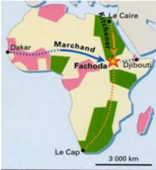
Fig. 2. Comparison of British and French colonization strategies in the African continent, <Fashoda Incident>(1898)

영국의 대 아프리카 정책은 Fig. 2의 그림처럼 아프리카 대륙을 상하로 나누는 종단 정책으로 대변된다. 영국은 북아프리카 지역의 이집트를 그들의 아프리카 침탈 본거지로 삼았다. 1875년 이집트를 차지하기 위해 수에즈 운하의 주식을 대거 매입하였고 1882년 이집트에서 발생한 반(反)영 민족운동에 대한 무력 진압을 계기로 이집트를 자신들의 보호국으로 삼았다. 이어 수단을 점령하고 남아프리카 연방을 건설했다. 이집트의 카이로에서 시작된 이 종단 정책은 1910년 남아공의 케이프타운까지 식민지로 삼으면서 비로소 완성되었다.