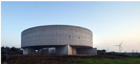
Fig. 3. Jeju Horse Museum, Yun Woongwon, 2012

제주 경관과 풍경요소를 건축적으로 차용한 사례는 윤웅원의 ‘제주 조랑말 박물관’, 방철린의 ‘제주 스테이 비우다’, 조재원의 ‘제주 돌집’, 이동기의 ‘라빌라’이다.