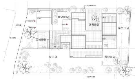
Fig. 2. SM1 House Layout Plan, Sun Eunsoo, 2013

제주 전통 민가를 더욱 적극적으로 현대적으로 적용하고 있는 제주지역 건축가는 선은수이다. 선은수는 Fig. 2의 SM1 주택 설계 초기부터 제주 민가의 재해석을 주택의 기본 개념으로 설정했다. SM1 주택은 제주 민가를 재해석한 우수한 작품으로 인정받아 2013년 한국건축문화대상 일반주거부문 본상을 수상했다. “제주 전통가옥의 공간배치의 개념을 이해하고 재해석하여 앞마당, 안뒤마당, 풍낭마당, 정낭마당, 송이마당, 놀마당으로 공간의 영역을 벽을 통해서 구분”[3]하고 이를 주택에 적용하였다. SM1 주택의 개념부터 계획까지 제주 전통 민가의 배치를 재해석한 것이다.