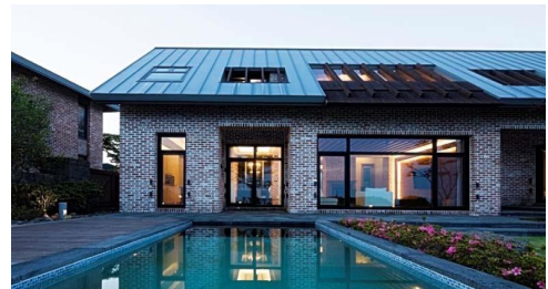
Fig. 5. La Villa, Lee Donggi, 2016

이동기는 “제주에서는 주변 경관요소에 어떤 건축물을 공간적 구성에 의하여 재료, 색채를 표현함에 따라 문화적 해석의 차이가 발생할 수 있다”[7]고 언급하면서, Fig. 5의 라빌라 재료에 송이로 만든 송이벽돌, 현무암 돌담, 제주 민가의 박공지붕 형태를 적극적으로 도입함으로써 지역성을 구현하고자했음을 명확히 했다.