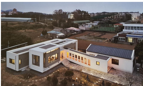
Fig. 1. Y House, Yang Gun, 2015

제주지역 건축가 양건은 제주 민가에서 발견되는 요소들의 현대적 변용을 통해 제주성을 찾고자 노력하는 건축가이다. 2006년 한국건축가협회 제주지회 작품전에서 ‘경계’를 주제로 한 제주 민가의 해석과 이를 적용한 작품을 전시하기도 하였다.