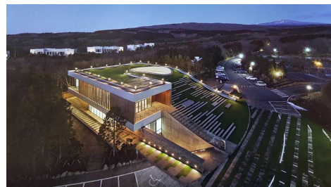
Fig. 8. CJ Nine Bridges The Forum, Lim Youngwhan, 2013

Fig. 8의 임영환의 나인브릿지 더 포럼은 골프 클럽하우스 내에 있는 신입사원 연수원이다. “한라산에서 먼 바다로 흐르는 지세에 직교하는 풍경의 판을 살포시 들어올리고 그 판 아래 프로그램을 삽입하는 방식으로 제주 땅에 대한 존중의 태도를 보인다...지형에의 순응을 통해 전통 제주 건축과 연계점을 찾을 수 있다...포럼은 그러한 새로운 지역성의 최전선에 위치한다”[10]라는 건축비평처럼, 더 포럼의 건축 형태에는 제주의 땅, 경관, 풍경에 대한 존중이 담겨있고, 이를 통해 제주의 지역성을 구현하고 있음을 알 수 있다.