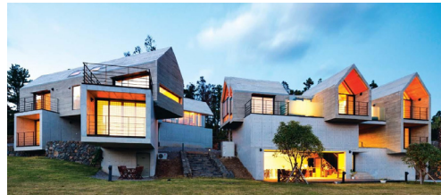
Fig. 4. Jeju Stay Biuda, Bang Chulrin, 2013

Fig. 4의 제주 스테이 비우다는 제주에서 흔히 볼 수 있는 풍경요소인 돌담과 굴 창고에서 건축형태를 차용했다. “제주 스테이 비우다의 설계는 삼다도의 요소로부터 시작되었다. 바람, 돌 그리고 그 돌 사이의 관계가 첫 주제이다. 제주도에서 흔히 볼 수 있는 돌담 속에는 제주도 민들의 지혜가 숨어있다...두 번째 주제는 제주도 굴 농장에서 흔하게 볼 수 있는 굴 창고에서 찾는다”[6]는 방철린의 언급처럼 펜션인 제주 스테이 비우다는 제주의 돌담과 굴 창고가 모티브가 되어 만들어졌다.