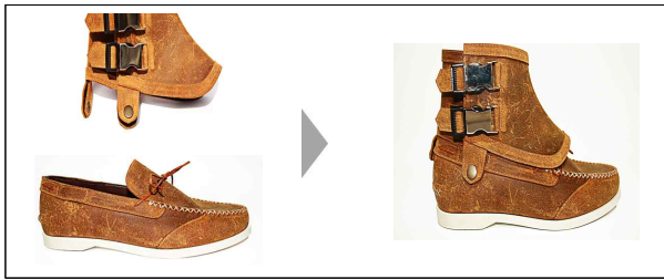
Fig. 3. Set of the detachable ankle accessory and shoes developed by a design entrepreneur