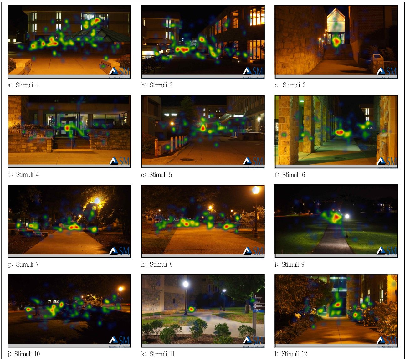
Figure 3. The results of AOIs using Heat map analysis

AOIs의 영역 지정을 통하여 가장 높은 면적을 차지한 경관 요소는 '도로'인 것으로 분석됐으나, '도로'에 대한 관심도가 높아 서이기보다는 전체 영역을 인지하는 일반적인 과정에서 나타난 결과라고 판단된다. Heat map을 통한 AOIs 영역 분석에서는 분산된 AOIs 영역이 나타난 결과보다는 어느 한 두 지점에 집중하여 AOIs가 나타난 결과를 주목할 필요가 있다. 12가지의 Heat map 분석 결과 중, 일부 지점에 국한되어 관심지역이 나타난 이미지는 3, 4, 9, 10 이미지(c, d, i, k)에 해당한다 (Figure 3 참조). 이 중 c, d개 이미지의 공통적인 특성은 관심지역의 영역이 문(door)에 고정되어 나타난 것이다. 한편, Stimuli 9번제인 (i) 이미지는 비스타 경관(일정 방향으로 축선을 가진 풍경)의 유형으로 소실점이 만나는 지점에서 관심 영역이 집중된 것으로 나타났으며, Stimuli 11, (k) 이미지의 경우