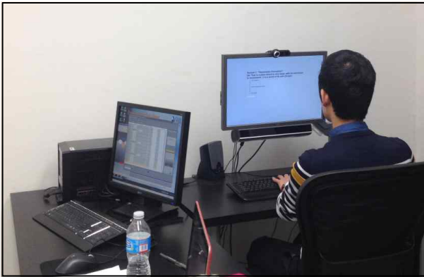
Figure 2. Experimental environment

체의 실험을 동반하는 아이트래킹 조사의 경우, 상대적으로 적은 표본수를 요구하는 것이 일반적이고, Kim(2016)에서는 아이트래킹 연구에서 대개 5~10명의 참여자를 대상으로 실시하는 것이 보편적이라고 제시한 바 있다. 피조사자는 20대에서 40대의 연령대로 구성되었으며, 아시안, 미국인, 중동인 등 다양한 국적을 가진 학생 혹은 연구원이었다. 피조사자의 남녀 비율은 53:47로 성별로 인한 연구 결과의 차이를 최소화하고자 하였다. 본 실험 수행 전 피조사자들에게 IRB(임상연구윤리위원회)에 제출·승인 받은 실험에 대한 개요에 대하여 충분히 인지시키고, 피조사자별 서명을 받은 후 Figure 2와 같이 개별적으로 실험을 진행하였다.