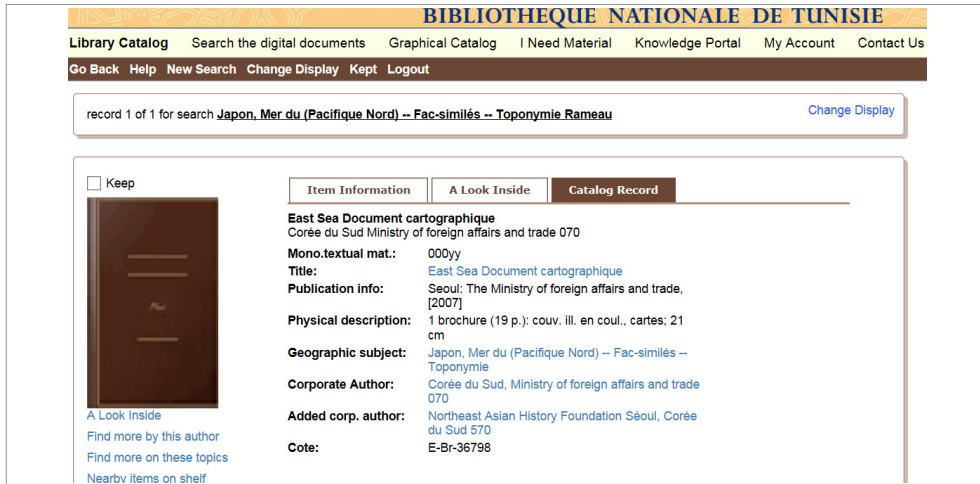
〈그림 5〉 튀니지 국가도서관의 목록레코드 예시

타나고 있다. 세부 주제명의 분포에서는 역사가 40건(11.4%)으로 가장 많고, 이어서 ‘정치(38)›문화(33)›사회(30)› …’ 순으로 나타나고 있다.