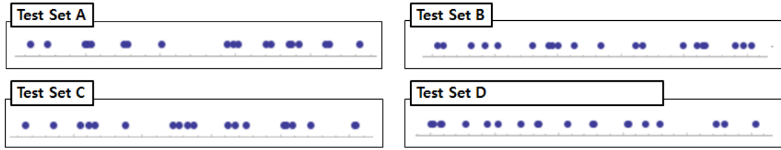
Fig. 3. Sample Test Set Graphing

가 요소의 값은 아래 Table 2.와 같다. 분산과 엔트로피 하나만 사용할 경우 테스트 케이스 평가 요소로 사용이 불가능하다는 것이 확인된다. 그리고 거리의 경우 테스트 셋 B가 가장 넓게 퍼져 있는 것을 잘 파악하였으나, 테스트 케이스 C와 D 중 D가 더 넓게 퍼져 있음에도 불구하고, 반대로 결과를 도출하고 있다. 제안하는 기법은 넓게 퍼진 순서대로 D, B, C, A를 찾아 테스트 케이스 평가에 뛰어난 것이 확인되었다.