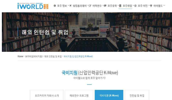
그림 1. 산업인력공단 k-move Fig. 1. Industrial Human Resources Corporation k-move

이러한 상황에서 본 논문은 우리나라 학생들이 선호하는 나라인 호주를 중심으로 현지 취업과 정착의 활성화를 위한 교육 방향을 잡기 위해 현지의 현황과 교육과정을 연구함으로써 향후 정책과 발전 방향성을 위한 기초 연구로서의 내용을 연구하였다. 한국의 해외 진출은 k-move의 형태로 노동력이 우리나라의 영토를 벗어나 해외에서 수입을 목적으로 일정기간 동안 고용되어 수입을 얻기 위해 자발적이고 일시적으로 이동하는 현상을 의미한다.