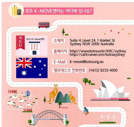
그림 2. 호주 관련 K-MOVE안내 브러그 Fig. 1. Australia k-move Information Blog

현대의 지식 정보 사회는 경험과 창의력이 중요시되는 사회이며, 자원과 자본보다 더 중요한 것이 경험이 만들어내는 창의성이라고 할 수 있다. 경험과 창의성을 갖춘 자원인 우수한 인적 자원으로 다국적 경험이 그 중요한 부분을 차지할 것이다. 이러한 것이 세계시장에서 경쟁력을 갖추는 길인 것이다. K-MOVE의 해외취업을 통해 폭넓은 직업 경험과 국가 간의 직업과 경험의 상호교류의 기반을 구축하고, 상호 국가경쟁력 강화를 도모할 수 있을 것이다.