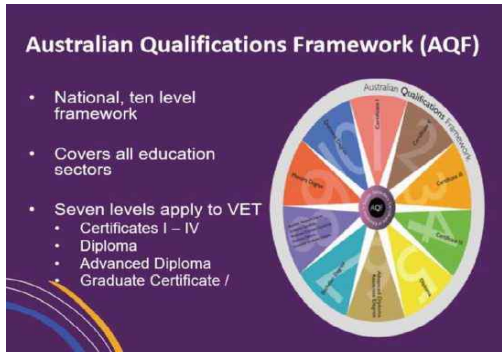
그림 3. 호주직업제도 AQF 설명 Fig. 3. Australia AQF Policy Information