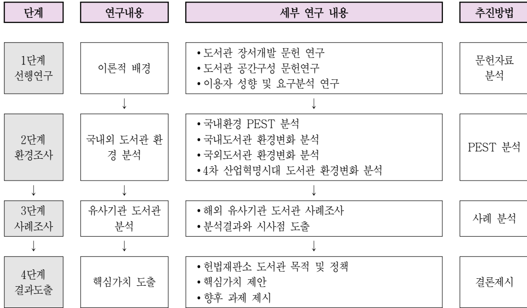
〈그림 1〉 연구 체계도

헌법재판소도서관의 현황과 역할·사명을 파악하는 등의 과정을 총체적으로 거쳐 헌법재판소 도서관의 핵심가치를 도출하였다. 본 연구의 세부적인 연구 체계도는 〈그림 1〉과 같다.