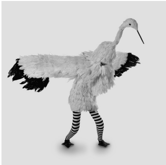
〈그림 2〉 학탈 의상