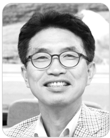
김 은 집

2015년 전문대학교를 시작으로 2017년 특성화고등학교에서 국가직무능력표준을 이용한 교육이 진행되고 있다. 산업체 또한 직무능력에 맞는 신입사원 채용을 하고 있지만, 아직은 많이 알려지지 않아 기업의 인사 담당자들마저도 잘 모르는 상황임으로 이것에 대한 인지가 필요하다고 생각된다. 따라서 이번 기회를 통해 국가직무능력표준을 여러 사람에게 알리고자 한다.