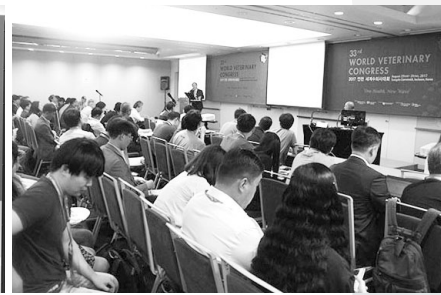
▲ AI, 구제역 등 다양한 세미나 개최