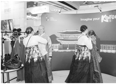
▲ 한국의 미를 알리는 부대행사 마련