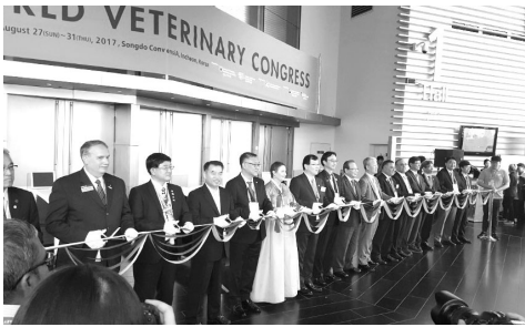
▲ 테이프 커팅