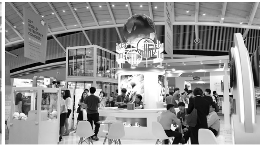
▲ 수의·축산·BT 관련 100여개 회사 200여개 부스 운영

AI 등의 방역분야 강의는 물론 수의임상분야에 한정하지 않고 동물복지, 수의학 교육 등 다