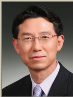
이 달 석