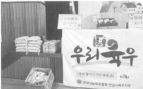
▲ 경품으로 육우육포, 육우등심 등이 증정됐다.