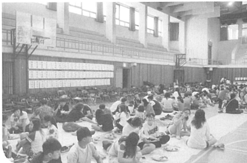
▲ 강당에서 이뤄진 점심식사. 행사 참가인원 전원이 즐거운 분위기 속에서 육우고기 점심을 나눴다.