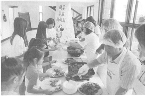
▲ 큰 호응 속에 육우 등심구이 메뉴가 배식되었다.