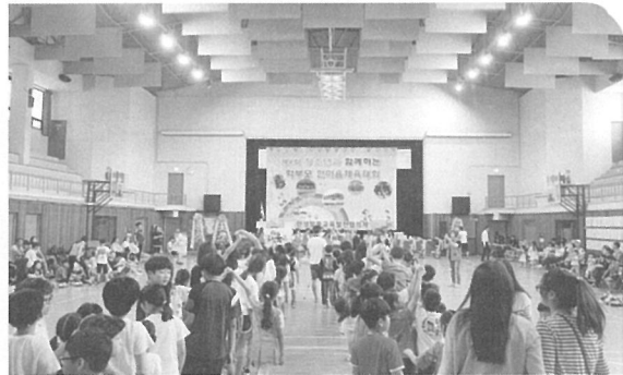
▲ 400여명의 안성지역 학교급식운영위 가족들이 참여하였다.

육우고기의 안정적인 소비처 확대 차원에서 초중고교 학교급식에 육우고기가 메뉴로 추가될 수 있도록, 그간 지역사회와의 소통을 이어온 안성시육우지부는 당일 안성지역 학부모로 구성된 안성맛춤교육발전협의회 행사기획과 진행에 주도적으로 나섰다. 일반 행사경품 조달을 위한 개인 기탁은 물론, 이날 점심식사시 소요된 고기와 경품으로 제공된 등심 120kg 물량 확보에도 노력을 기울였다.