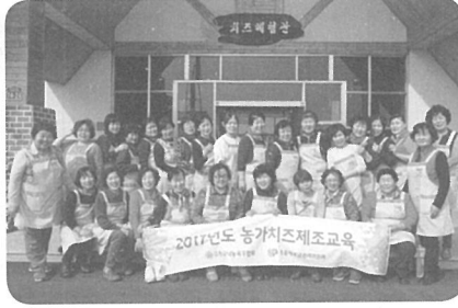
▲ [충북] 충북낙협 치즈체험관(4월 13일)