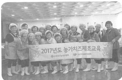
▲ [전남] 전남농업기술원(4월 18일)