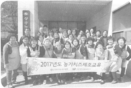
▲ [경북] 상주시농업기술센터(4월 12일)