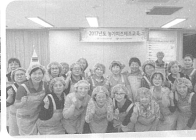
▲ [강원] 흥천군농업기술센터(4월 21일)