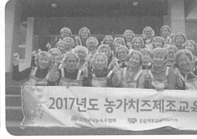
▲ [경기남부] 이천시농업기술센터(4월 14일)

FTA 시대속 낙농가들의 경쟁력을 높일 수 있는 농가치즈제조교육이 성황을 이루고 있다.