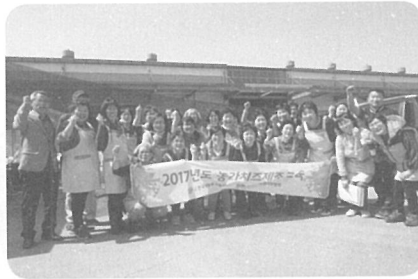
▲ [전북] 동진강낙협 경제사업장(4월 19일)