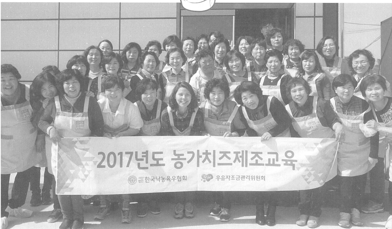
▲ [경남] 태원목장(4월 11일)