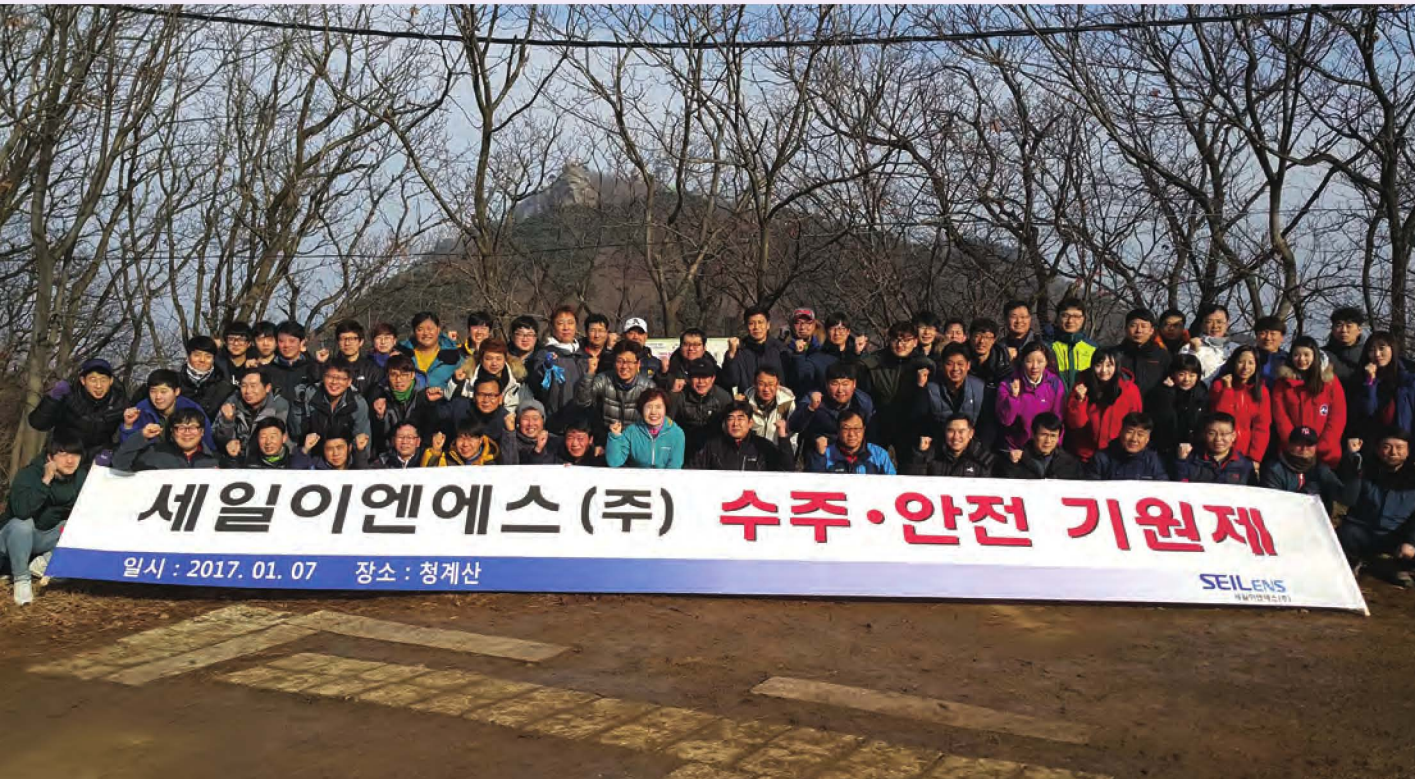
세일이엔에스는 지난 1월 7일 청계산에서 2017년 수주 · 안전기원제를 열고 신년목표 및 무재해 달성을 다짐했다