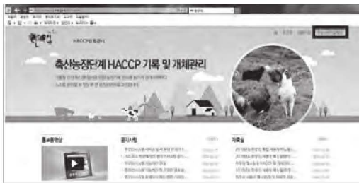
〈한우리 누리집에서 가축사육 기상정보시스템 연계〉