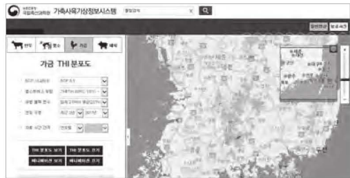
〈가축사육 기상정보시스템 주요화면〉