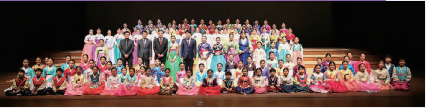
(주)코젠은 창립 35주년 기념식을 '인간문화재 양승희와 제자들의 가야금 향연' 공연과 함께 개최했다

(주)코젠(대표 윤영근)은 지난 3월 8일 국립국악원 예약당에서 창립 35주년 기념식 및 2017 국가무형문화재 제23호 가야금산조 및 병창 공개행사인 '인간문화재 양승희와 제자들의 가야금 향연' 공연을 개최했다.