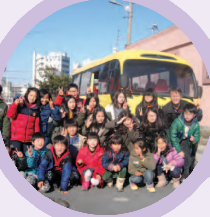
▲전북 익산 소재 아동 복지시설의 운행차량 구입·기증