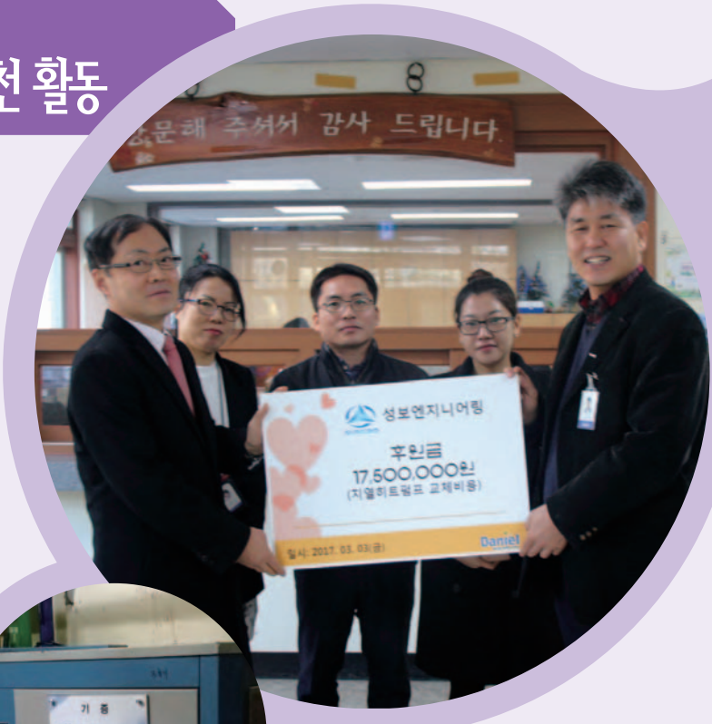
'다니엘복지원'에 지열히트펌프 교체 지원

(주)성보엔지니어링은 기계설비업계 일원으로 사회에 대한 재능기부를 통한 봉사와 이웃사랑을 실천하기 위해 지난 2012년부터 '1+1 기부제도'를 시행하여 다양한 기부 활동을 적극 펼치고 있다. '1+1 기부제도'란 임직원들이 매월 급여의 1%를 기부금으로 내고, 회사도 임직원들의 기부금과 같은 금액을 기부하여 기부금 예산으로 활용하는 제도이다. 성보엔지니어링은 이 제도의 독립적 운영과 이웃사랑 실천을 높이기 위해 6명의 임직원으로 구성된 '세상의 이웃과 함께하는 성보회(회장 이용직 상무)'를 구성하여 회사와는 별도로 운영하고 있다. 성보회는 매년 약 7천만원의 기부예산을 확보하여 국내외 각종 재해지역 및 어려운 이웃들에게 사랑을 실천하고 있다.