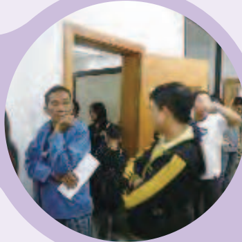
◀ 3국인을 위한 무료진료소 진료시설 건립 지원