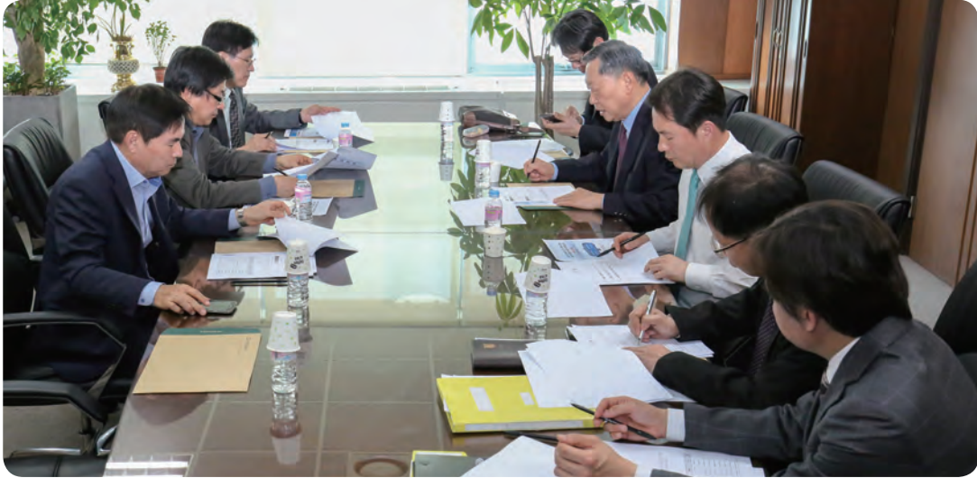
기계설비산업선진화위원회가 지난 4월 11일 개최됐다

기계설비산업선진화위원회(위원장 유호선)는 지난 4월 11일 기계설비건설회관 소회의실에서 제1차 회의를 개최했다.