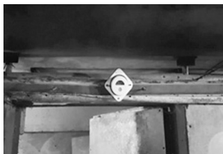
〈사진 2〉 축사환경 모니터링 예

혼합하여 관리할 수 있는 기술이 발달되어 있지 않을 뿐만 아니라, 아직까지 개발된 장비가 없는 실정이다. 그러므로 양계분야에 있어서 ICT 시설이란, 가축을 키우는 사양시설 대부분이 ICT 관련 시설이고 농장에 설치해야 하는 시설이라고 보는 것이 타당하다고 하겠다. 사양관리 시설은 계사내 환경을 관찰(음수, 사료섭취 등)할 수 있는 모니터링 즉, CCTV(closed-circuit television)를 활용한 환경관리와 실제 계사 시설을 운용하는 동물복지 시설(평사 단상, 직립형 대체 케이지 시설 등)이 있다. 따라서 동물복지 기준 강화에 대비하여 가장 손쉬운 축종은 양계라고 할