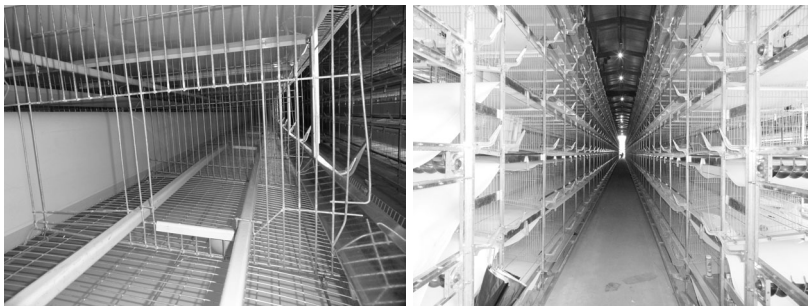
대체 케이지 사육시설