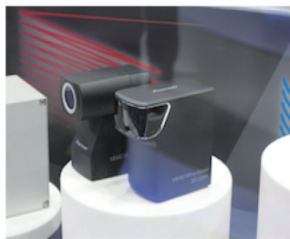
3차원 LiDAR 최종 샘플