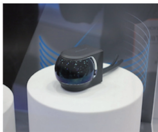
광각 타입 LiDAR