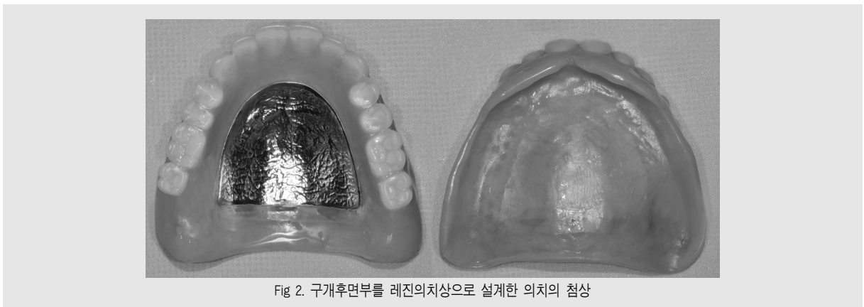
Fig 2. 구개후면부를 레진의치상으로 설계한 의치의 침상

무치악환자에 있어서 총의치를 이용한 수복은 연마면 뿐만아니라 조직면도 주기적인 검사가 필요하다는 점에서 고정성보철치료와는 다른 개념의 치료라고 할 수 있다. 의치의 급여화로 무치악환자가 총의치로 구강을 회복할 수 있는 기회는 더 늘어났다. 총의치환자는 치조골과 점막의 변화 때문에 다른 고정성 보철과는 달리 끊임없이 유지관리를 해주어야 한다. 때문에 새로운 의치를 장착한 뒤에 시행하는 적극적인 검진과 유지관리는 환자의 구강건강관리뿐만 아니라 잠재적인 수요창출면에서도 도움이 될 것이라 사료된다. 따라서 임상 의는 기본적인 총의치의 유지관리 개념과 기본적인 방법을 숙련시켜야 할 것이다.