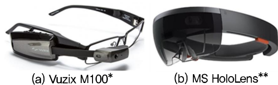
(그림 2) 뷰직스와 마이크로소프트의 증강현실 기술

뷰직스는 1997년 설립된 제조기업으로 2013년에 세계 최초로 상용화된 안경형 증강현실 디바이스 ‘Vuzix M100’을 출시하였다. (그림 2)에서 보듯이 안드로이드