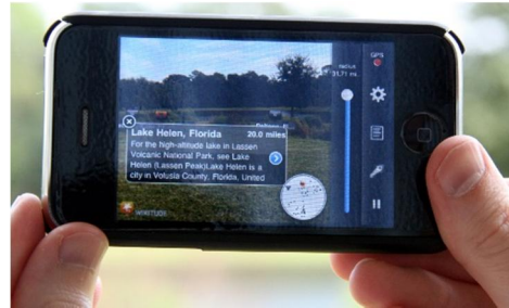
(그림 1) 증강현실

증강현실 연구는 1960년대 van Surtherland가 최초의 see-through HMD를 개발한 것에서 시작되었으며, 1990년대초 보잉사가 'Augmented Reality'라는 신조어