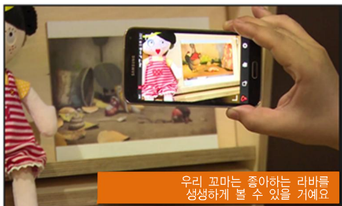
(그림 5) 국내의 AR 기술 - SK텔레콤 ‘T-AR’ 플랫폼

엠게임은 증강현실 게임으로 2016년 모바일 증강현실 카드 배틀게임 ‘태권히어로즈 AR’를 출시했다. (그림 5)에서 보듯이 국기원과 협력해 만든 캐릭터 ‘타이온’을 활용한 게임이다. 포켓몬고의 흥행으로 증강현실 기술을 접목한 게임의 성공 가능성을 확인할 수 있어 온라인