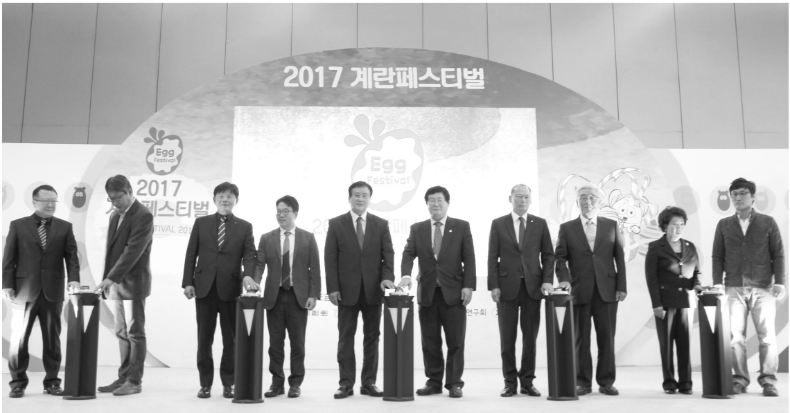
▲ 지난 11월 1일 양재 aT센터에서 열렸던 2017 계란 페스티벌 개막식

계란자조금관리위원회(위원장 남기훈)가 주최·주관한 제6회 2017 계란 페스티벌이 지난 1일부터 4일까지 서울 양재동 aT센터 제2전시장에서 개최되었다. 계란 페스티벌은 지속적인 계란 소비를 유도하고 소비자들이 계란에 대한 올바른 인식을 가질 수 있도록 완전식품 계란의 영양학적 가치를 이해하기 위한 온 가족이 함께 즐길 수 있는 체험형 페스티벌이다. 페스티벌에서는 단체급식에 활용 가능한 계란 요리 레시피를 발굴하는 계란 요리 경연대회, 계란 산업발전과 계란 소비촉진을 위한 대학생 계란 소비 캠페인 아이디어 공모전, 에그스타와 함께하는 어린이 계란 창작 뮤지컬, 온 가족이 참여하는 계란요리교실 등의 행사가 펼쳐졌다. 또한, 계란 산업전·계란 요리 주부릴레이 전시와 같은 전시 Zone, 계란비누 만들기·계란잼 만들기·계란 핫바 시식과 같은 체험 Zone, 계란상식 OX퀴즈·계란롤렛 돌리기와 같은 이벤트 Zone을 운영하여 더욱 다채로운 행사가 되었다.