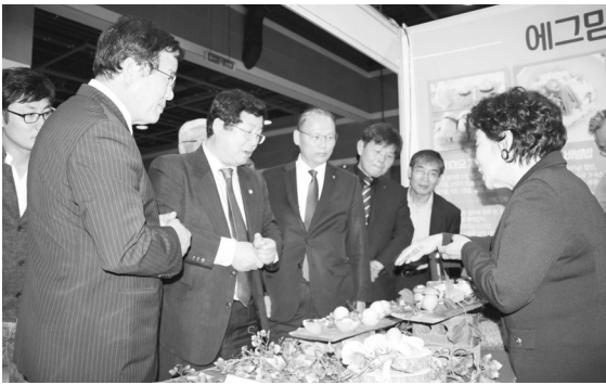
▲ 전시 관람 투어