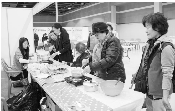
▲ 계란 비누 만들기 등 체험관