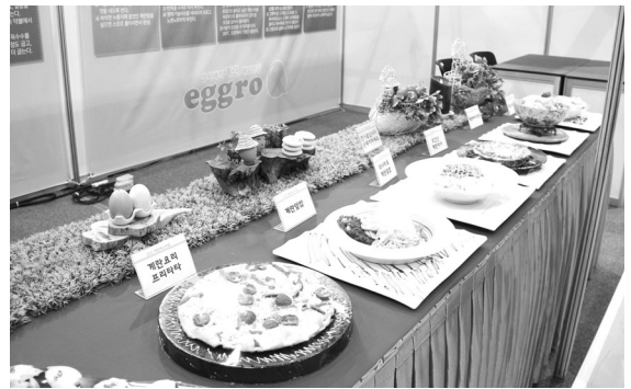
▲ 계란요리 전시관