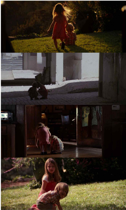
[Fig. 1] cove's lovely children in his dream sequence

영화 속에서 나타내고자 하는 통제할 수 없는 잠재의식의 경지를 의미하는 동시에, 꿈의 세계에 지나치게 집착하다 인생의 방향을 잃은 코브의 모습을 의미하기도 한다. 즉, 이는 코브의 잠재의식의 억압이 꿈에 미치는 영향을 예시하고 있는 것이며, 비록 그가 이 기억을 자신의 마음 속 깊은 곳에 은닉해 두어도, 여전히 잠재의식이 만든 강박관념은 통제할 수 없다는 프로이트의 이론을 활용하고 있는 것이라 할 수 있다[Fig. 2].