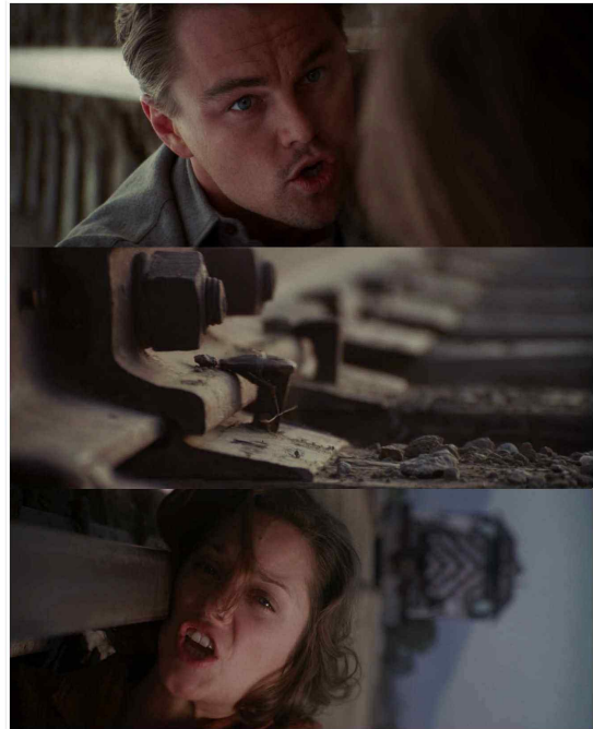
[Fig. 2] Subconscious in dream sequence

또한 극중에서 코브의 꿈은 그의 잠재의식 속 소망을 분출하는 동시에 꿈의 보충 기능을 실현하고 있는데 영화 속에서 그가 후회되는 순간들을 돌리기 위해서 꿈을 꿀 수밖에 없다며 자위하는 장면은 그의 잠재의식 속의 실현할 수 없는 소망들이 마치 실현된 것처럼 위장된 형태로 재현되는 것을 알기 때문이다.