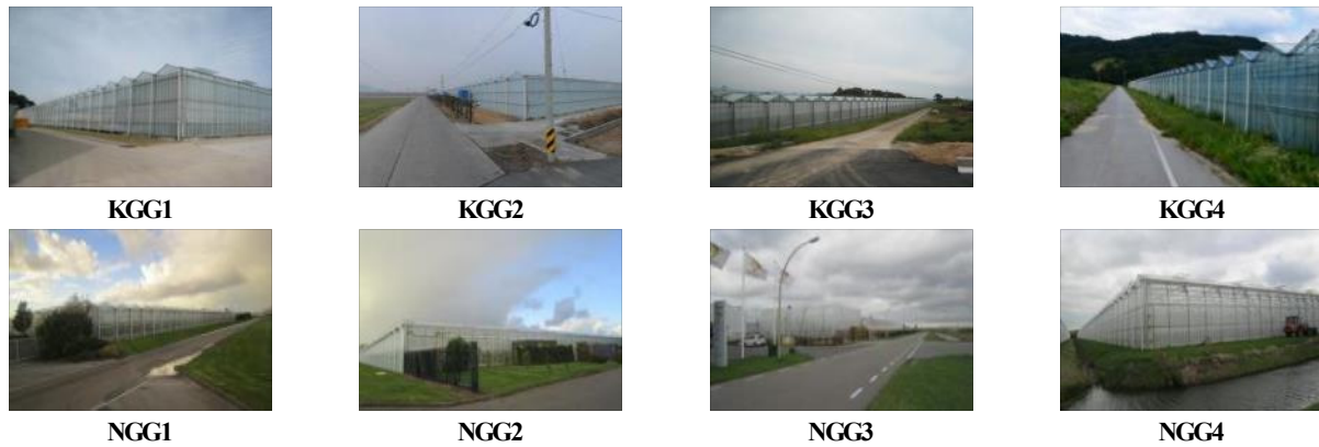
Figure 1. The image slide of study sites

PF: Paddy field, KVG: Korea Vinyl Greenhouse, JVG: Japan Vinyl Greenhouse, KGG: Korea Glass Greenhouse, NGG: Netherlands Glass Greenhouse.