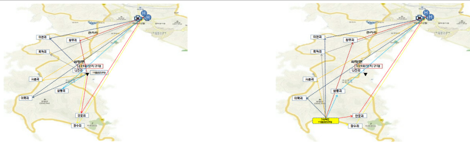
Fig. 1. Moving route according to the position of the present & virtual 119 Emergency medical service