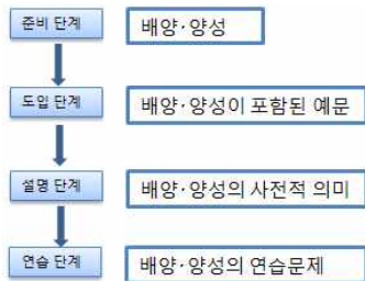
(그림 1) 사고도구어 유의어 교육 단계

인지적 전략을 활용한 유의어 교육은 도입단계, 설명단계, 연습단계의 3단계로 진행된다. 교수에 들어가기 전에 교수자는 사고도구어에서 유의어를 선정한다. 도입단계에서는 학생들의 흥미를 유발하며 짧은 글을 통해 학생들에게 유의어의 의미를 추측하도록 한다. 학생들의 흥미가 유발되면 자연스럽게 설명단계로 넘어간다. 설명단계는 예문을 통해 제시된 어휘의 의미를 파악할 수 있게 한다. 학생들의 의미파악이 끝나면 유의어에 대한 공통점과 차이점을 학생들에게 평가하고 평가결과에 따라 보충·부연 설명을 진행한다. 연습단계에서는 유의어의 공통적인 의미와 변별적인 의미를 구별해서 사용할 수 있도록 연습문장을 준비하여 유의어 찾아쓰기, 문장에 알맞은 유의어 고르기 등 여러 활동을 할 수 있도록 구성한다. 유의어는 어휘 능력을 빠르게 신장시키며 사고도구어 확장에 매우 적합한 방법이다. 전문대학 교육에서 유의어를 따로 목록화 하여 교수하지는 않기 때문에 효율적인 학습이 이루어질 수 있도록 사고도구어를 유의어군 끼리 모아서 교육해야 한다. 이를 도식화시키면 다음과 같다.