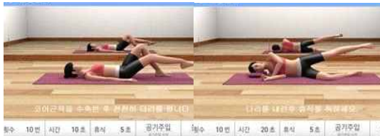
그림 3. 운동 프로그램 예시 Fig. 3. Examples of exercise programs

디지털 압력 바이오피드백 장치의 몸통 안정화 운동을 위한 운동 프로그램은 태블릿PC의 안드로이드 기반으로 제작되었다. 운동 프로그램은 총 30개의 운동이 있으며, 자세에 따라 바로 누운 자세, 옆드려 누운 자세, 옆으로 누운 자세로 구성되고, 각 운동은 초급, 중급, 고급으로 난이도를 조절하였다. 바로 누운 자세는 초급 5개, 중급 5개, 고급 6개로 코어근육 셋업, 다리 밀기, 다리 벌리기 등 총 16개의 운동으로 구성되어 있다. 옆드려 누운 자세는 초급 4개, 중급 6개, 고급 2개로 무릎 구부리기, 다리 들기, 엉덩관절 돌리기 등 총 12개로 구성되었으며, 옆으로 누운 자세는 초급으로 다리 들기와 다리 벌리기 2개의 운동으로 구성되었다(그림 3)(그림 4).