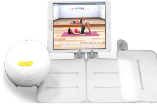
그림 1. 디지털 압력 바이오피드백 장치 Fig. 1. digital pressure bio-feedback device

개발된 디지털 압력 바이오피드백 장치는 본체, 에어쿠션, 태블릿PC, 거치대로 구성되어 있다. 본체는 제어 보드, 압력센서, 펌프 모터, 솔레노이드 밸브, 블루투스를 포함하고 있다. 에어쿠션은 293×203mm 크기로 우측과 좌측으로 구분이 되며, 본체와 연결되는 에어노즐이 양측 중간에 있다(그림 1). 하드웨어의 사양은 표 1에 제시하였다. 압력센서에 의해서 화면에 표시되는 압력의 정확성을 위해 한국기계전기전자시험연구원에 의뢰하여 공기압력 오차 시험을 실시하였다. 1mmHg 간격으로 표시가 이루어지고, 20mmHg에서 45mmHg까지의 범위에서 18개의 압력을 시험 압력으로 주입하고 압력계로 측정하였다. 그 결과 압력의 편차는 0.99mmHg (범위 0.01~2 mmHg)로 나왔다. 기존 수동 바이오피드백 장치의 압력 표시가 2mmHg 간격으로 되어있고, 바늘로 움직이게 되어있어서 정확하게 압력을 확인하기 어려운 반면, 개발된 본 제품은 1mmHg 간격으로 디지털로 숫자로 표시가 되며, 그 오차 범위도 1mmHg보다 적어서 운동수행에 적합한 장비로 확인되었다.