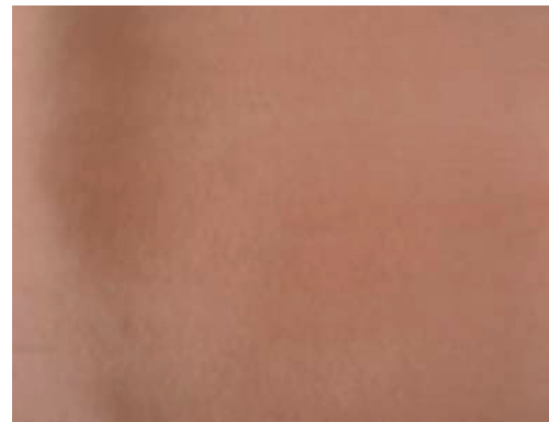
Fig. 2. Silk fabric dyed with Chamaecyparis obtusa and Rubia tinctorum .

지고 있는 것으로 나타났으며, 동시에 b*값이 20.81로 황색 기를 가지고 있음을 알 수 있었다. 채도 C는 5.39로 편백나무 잎 추출물로 염색한 견직물보다 채도가 높게 나타났다(Fig. 2).