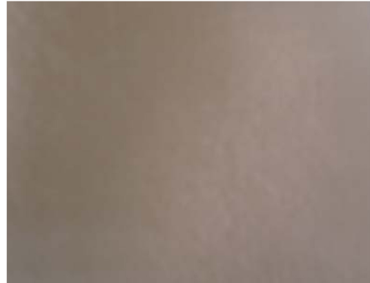
Fig. 1. Silk fabric dyed with Chamaecyparis obtusa .

다음으로 편백나무 잎과 꼭두서니의 복합 염색 견직물 색상은 1.6YR로 yellow - red계열이었으며, 명도를 나타내는 Munsell의 V값이 7.19 그리고 CIE L*값이 72.49로 비교적 밝은 색이었으나, 편백나무 잎 추출물로 염색한 견직물보다 명도가 다소 낮게 나타났다. 그리고 a*값은 19.52로 적색 기를 가