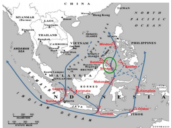
Fig. 3. Major shipping routes and Choke points.

인하여 이곳 항로를 포기하고 다른 곳으로 우회 운항할 경우 최소 1~2일 이상 더 항해일수가 늘어난다. 또한 이슬람 무장 세력들이 저지른 선원납치와 선박파괴 그리고 운항저해로 인한 피해도 막대하다. 공식적으로 발표된 바는 없지만 납치된 선원 석방금으로 해적들에게 지급하는 금액이 엄청난 것으로 알려져 있다. 인접국과 아시아 그리고 세계의 원활하고 안전한 해상물류와 경제활동을 위해서 관련국 뿐만 아니라 국제적으로 동 해역에 대한 해상치안 확보에 힘을 쏟아야 한다. 그 몇 가지 실행방안을 여기에 제시하고자 한다.