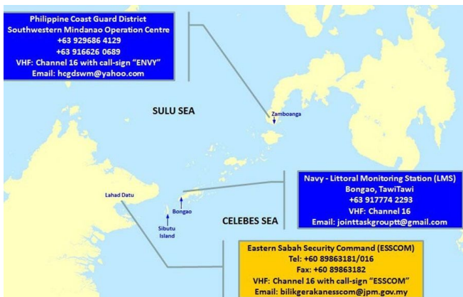
Fig. 4. Ship's three Contact Centers.