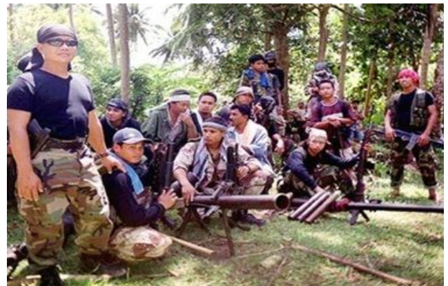
Fig. 2. Members of Abu Sayyaf Group.

공격자들이 사용한 보트는 대부분 고속 보트였다. 이들 보트 색깔은 회색 또는 흰색이거나 녹색이 많았다. 단색으로 칠한 경우도 있고 흰색이나 청색의 띠 모양으로 칠한 것도 있었다. 전체 사건 중 5건은 나무로 만든 재래식 보트를 사용했다.