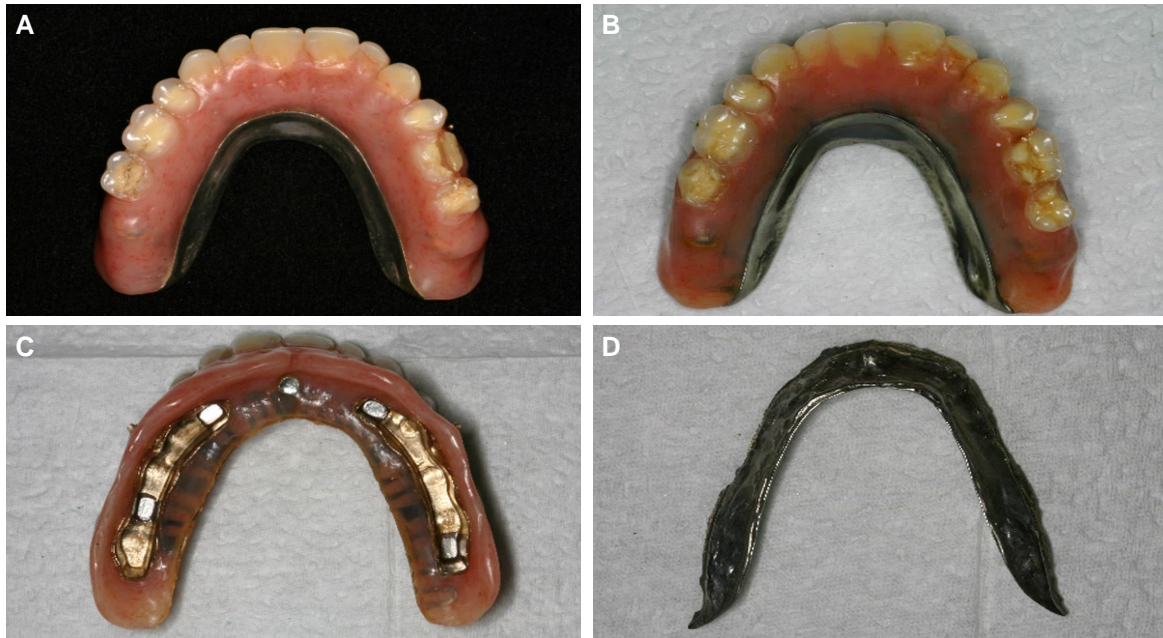
Fig. 2. Prosthetic complications in case 1. (Implant overdenture) (A) Resin teeth fracture after 1 year and 7 months, (B) Resin teeth fracture after 3 years and 11 months, (C, D) Framework fracture after 8 years and 5 months.

고도의 치주염에 이환된 상악의 모든 치아는 발치하기로 결정하였다. 발치 후 CT를 촬영하여 검사한 바, 상악 전치부는 심한 골 소실로 인해 임플란트 식립이 어려웠다. 환자는 이전 경험을 바탕으로 의치 보다는 가급적 고정성 보철물을 이용한 치료를 요구하였다. 이에 상악 양쪽 구치부에 각각 3개씩의 임플란트(Standard Plus Straumann, Straumann, Waldenburg, Switzerland)를 식립하여 임플란트 지지 고정성 보철물로 수복하며, 전치부는 양호한 구순 지지를 형성할 수 있도록 Kennedy class IV 가철성 국소의치로 수복하는 것으로 치료계획을 수립하였다. 하악 전치부는 양측 측절치를 연결하는 4본 고정성 보철물과 함께 하악 좌측 제1, 2대구치에 임플란트(Standard Plus Straumann, Straumann, Waldenburg, Switzerland) 식립을 통한 임플란트 지지 고정성 보철물 수복을 계획하였다.