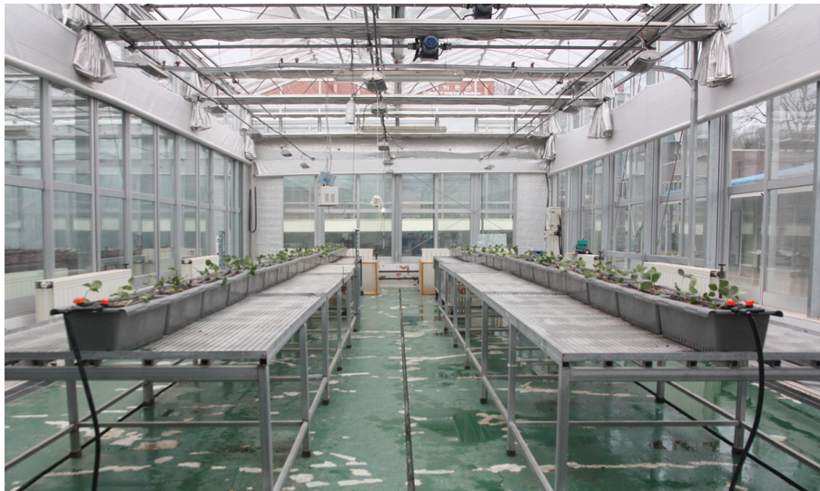
Fig. 1. View of transplanted 'Maehyang' strawberry for testing the effect of the application method and concentration of cytokinin.

시설딸기 '매향' 유묘를 2016년 2월 22일에 상업용 혼합상토인 토실이(Tosilee, Shinan Grow Co. Ltd., Korea)를 이용하여 딸기 전용 재배 포트(64×27×18cm)에 정식한 후 6월 20일까지 경상대학교 부속농장 벤로형 유리온실에서 재배하였다(Fig. 1). 딸기 유묘는 화아분화를 위한 저온요구도를 만족시키기 위해 동절기 동안 저온 저장고(-1.5°C)에 4개월간 저장하였다. 유묘의 정식 후 온도는 주간평균 26°C, 야간평균 16°C, 광합성유효광양자속은 185-370 \mu\text{mol}\cdot\text{m}^{-2}\cdot\text{s}^{-1} 이었다. 재배기간 동안의 관주는 점적테이프를 이용하였고, 네덜란드 Sonneveld 조성(Sonneveld와 Straver, 1994)의 딸기 전용 배양액을 조제하여 사용하였다(Table 1). 배양액의 공급은 정식 후 7일 동안은 EC 수준을 0.65dS·m -1 로 맞추어 뿌리 활착