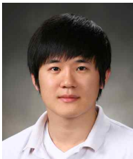
이 근 민