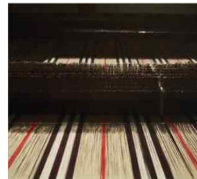
<Fig. 8> Weaving the Burberry Check (Burberry Instagram, 2015.10.13.)