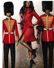
<Fig. 7> Festive Campaign -Naomi Campbell (Burberry Instagram, 2015.11.3.)