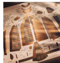
<Fig. 12> Over 100 process of Burberry Trench Coat (Burberry Instagram, 2014.8.27.)