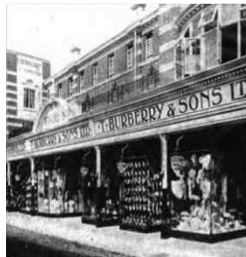
<Fig. 2> Burberry & Sons in Basingstoke, 1880