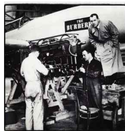
<Fig. 3> Britain's first flight dressed in Burberry