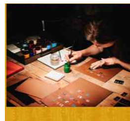
<Fig. 27> Burberry Artisan's hand-caligraphy