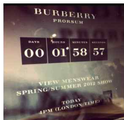
<Fig. 21> S/S12 Menswear live show (Burberry Instagram, 2011.6.18.)