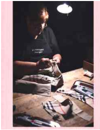
<Fig. 13> Burberry Artisan's hand-finish (Burberry Instagram, 2014.6.20.)