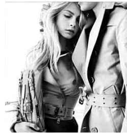
<Fig. 15> Cara and Jacob in S/S11 Campaign (Burberry Instagram, 2011.5.22.)