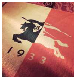
<Fig. 10> Burberry Equestrian Knight logo (Burberry Instagram, 2014.6.26.)