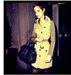
<Fig. 16> Emma Watson in the first Burberry Bespoke (Burberry Instagram, 2011.3.13.)