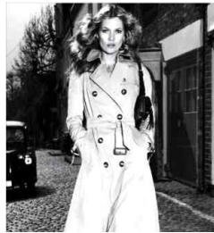
<Fig. 14> Kate Moss in 2004 AD Campaign (Burberry Instagram, 2011.3.8.)