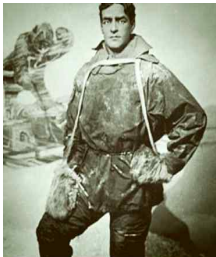
<Fig. 1> Ernest Shackleton in Burberry

실 중 원하는 색상을 선택할 수 있으며<Fig. 26> 버버리 홈페이지를 통해 어떤 실현되는지 확인이 가능하다(Cosmopolitan, 2016). 버버리 인스타그램은 2016년 6월 9일, 리젠트 스트리트 플래그십에서 6월 10일~30일 동안 진행될 'A Celebration of