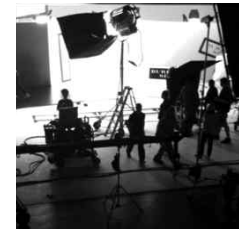
<Fig. 20> Behind the Scene Shots (Burberry Instagram, 2011.2.13.)