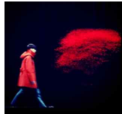
<Fig. 19> Burberry Beijing Hologram event