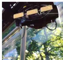
<Fig. 22> S/S14 Collection capturing by iphone5s (Burberry Instagram, 2013.9.18.)