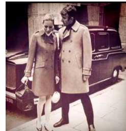
<Fig. 4> Burberry Campaign 1968 (Burberry Instagram, 2011.5.20.)