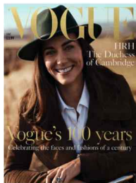
<Fig. 5> The Duchess in British Vogue (Burberry Instagram, 2015.11.3.)