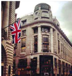
<Fig. 6> Burberry London Flagship (Burberry Instagram, 2013.6.16.)