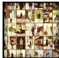
<Fig. 23> Art of the Trench