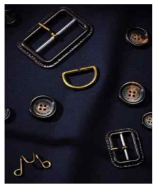
<Fig. 9> Signature Details (Burberry Instagram, 2015.10.16.)