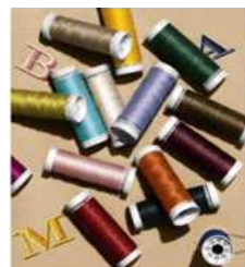
<Fig. 26> Monogram Threads