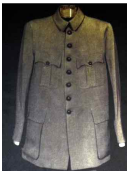
〈Fig. 5〉 Mao Suit of Sun Wen, 1923 (goo.gl/rsnFOt, n.d)

바뀌었고 원래 3개였던 인사이드 플랩 포켓(inside flap pocket)을 수정하여 위·아래로 총 4개의 아웃사이드 플랩 포켓(outside flap pocket)을 부착하였으며 두 장 소매에 전체적으로 뾰뚱한 와이셔츠를 입은 것처럼 딱딱한 디자인으로 변형되었다 〈Fig. 5〉. 더불어 바지는 단추로 여미고 양 옆에는 큼지막한 인사이드 포켓을, 허리춤에는 작은 시계 포켓을 만들고 오른쪽 엉덩이에 덮개가 있는 인사이드 포켓을 하나 더 추가하여 덮개를 달아 마무리하였다(Hwa & Kim, 2008). 이 시기의 중산복