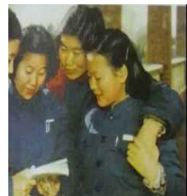
<Fig. 17> Clothes of Young People, 1960s (Zhang & Cao, 2012, p. 338)