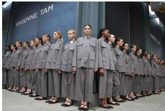
<Fig. 29> Vivienne Tam 2008 S/S N.Y. (vogue.com, n.d.-e)

며 팔자형 스탠드 칼라에 5개의 단추와 4개의 포켓을 대칭으로 부착하여 중산복의 디자인을 응용하였다. 여기에 블랙 컬러의 벨트를 매어 허리에 포인트를 주어ミリ터리 룩을 연출하였다. <Fig. 29>는 디자이너 Vivienne Tam의 2008 S/S 의상으로 중산복의 형태미를 살린 품이 넓은 회색 상의와 팬츠를 매치함으로써 직선적인 머스쿨린 룩을 연출하였다. 특히 이 컬렉션은 Vogue.com