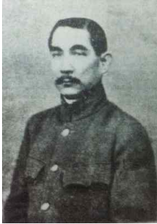
〈Fig. 3〉 Sun Wen, 1912 (Bian, Ma, Dan & Wang, 2014, p. 41)