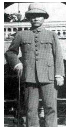
<Fig. 10> Mao Suit of Sun Wen, 1923 (Yuan, 2007, p. 54)