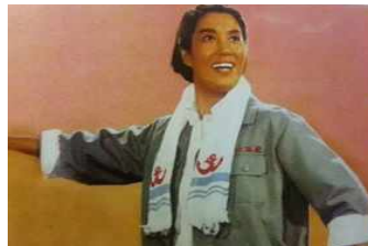
<Fig. 16> Working Clothes, 1960s (Zhang & Cao, 2012, p. 345)