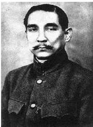
<Fig. 8> Mao Suit of Sun Wen, 1912 (Yuan, 2007, p. 54)

1949년부터 1965년까지 중화인민공화국 건립과 문화혁명을 거치면서 경제발전 및 문화교류 등에 많은 변화가 있었으며 이는 중산복의 형태 변화에 직접적인 영향을 주었다(Kim, 2012). 특히 이 시기에는 남녀노소를 불문한 대부분의 중국인들이 중산복을 평상복으로 널리 착용하여 '인민복(人民服)'이라는 명칭으로 불리며 가장 대중적으로 착용되었다(Liu, 2015). 또한 마오쩌둥, 저우언라이(周恩來, 1898~1976), 덩샤오핑 등 중국의 대표적 정치가들이 각종 회의와 외국사절 접견 시 정장으로 착용함으로써 중국 지도자들을 상징하는 의상으로 여겨졌으며 마오쩌둥의 이름에서 연유해 마