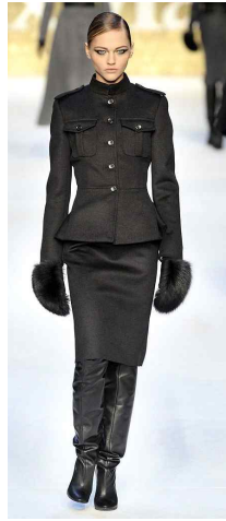
<Fig. 26> Max Mara 2010 F/W Milano (vogue.com, n.d.-c)