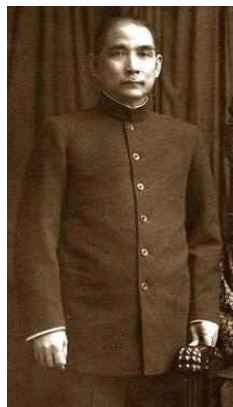
<Fig. 9> Mao Suit of Sun Wen, 1920