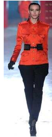
<Fig. 28> Jason Wu 2012 F/W N.Y. (vogue.com, n.d.-d)