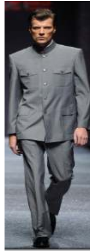
〈Fig. 23〉 Chenkun 2011 S/S Beijing