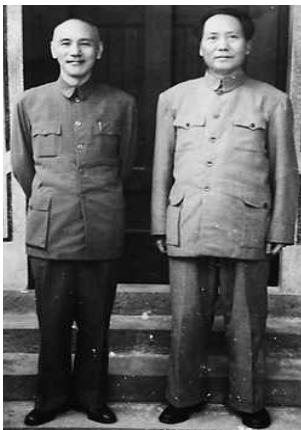
<Fig. 11> Mao Suit of Chiang Kai-shek (Left) & Mao Zedong(Right), 1945