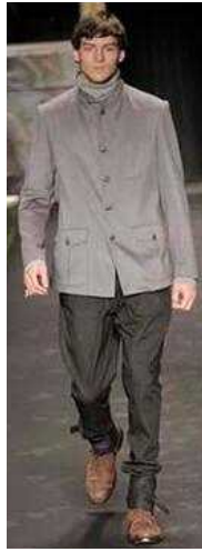
〈Fig. 22〉 Rag & Bone 2008 F/W N.Y. (vogue.com, n.d.-a)