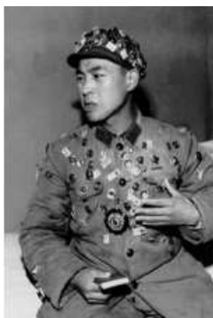
<Fig. 15> Uniform of Hongwi Byeong 1960s (Kim, 2012, p. 36)