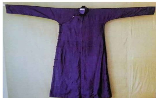
<Fig. 2> Jang Po, 1910s (Chen & Zhu, 2008, p. 271)

이후 중산복은 1923년 쑨원이 광저우(廣州)에서 중국혁명정부 대원수 취임에 착용한 것을 계기로 중국 복식사에 정식 등장하였으며(Zhang, 2010), 이때 착용한 형태가 기본 형태로 정착되었다(Zhang, 2012). 이 중산복 재킷의 칼라는 이전의 스탠드칼라에서 팔자형(八字形) 스탠드칼라로