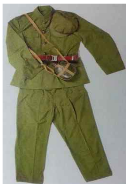
<Fig. 14> Military Uniform, 1960s (Bian, Ma, Dan & Wang, 2014, p. 74)

1990년대는 중산복이 중국을 상징하는 남성복으로 서양 패션디자이너들의 관심을 끌기 시작한 시기이며 2000년 이후에는 중국의 학자들이 중산복