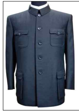
<Fig. 20> Eight-Shaped(八) Stand Collar Mao Suit (goo.gl/UNxID8, n.d)