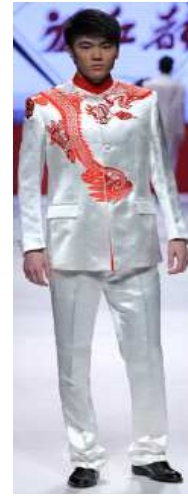
〈Fig. 24〉 Hongdu 2011 F/W Beijing (english.chinafashi onweek, n.d)

Fashion Week에 출품된 Chenkun(陳坤)의 의상으로 높은 스탠딩 밴드칼라에 5개의 단추와 4개의 포켓이 중산복 원형을 충실하게 재현하고 있는 것으로 보인다. 〈Fig. 24〉는 2011 F/W Chinese Fashion Week에서 발표된 Hongdu의 작품으로 스탠딩 밴드칼라와 5개의 단추, 상의 하단 양 옆의 포켓 등 중산복의 형태적 특성을 그대로 활용한 것을 확인할 수 있다. 특히 흰색 실크에 붉은색 용문양 자수를 가미함으로써 중국색을 더욱 직접적으로 표현하고 있다고 생각된다.