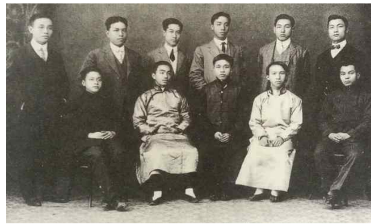
<Fig. 1> Western Suit & Jang Po, in the early 1900s (Hwa & Kim, 2008, p. 66)

라고 하여(Chen, 2014, p.19), 중국 전통식 장포에 영국식과 일본식이 가미된 새로운 형태의 의복에 대한 호평을 한 바 있으며, 1916년 이후 쑨원을 비롯한 혁명당원들은 중산복을 혁명의 상징으로 착용하기 시작하였다(Bian, Ma, Dan, & Wnag, 2014).