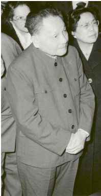
<Fig. 18> Mao Suit of Deng Xiaoping, 1979