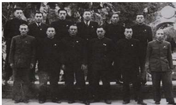
〈Fig. 6〉 Uniform of Kuomintang of China, 1926 (997788.com, n.d)