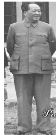
<Fig. 13> Mao Suit of Mao Zedong, 1959 (goo.gl/yuY9uv, n.d)