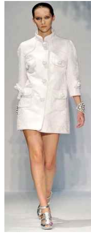
<Fig. 27> Andrew GN 2009 S/S Paris (firstview.com, n.d.-b)