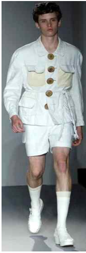
〈Fig. 21〉 Steve J & Yoni P 2008 S/S London