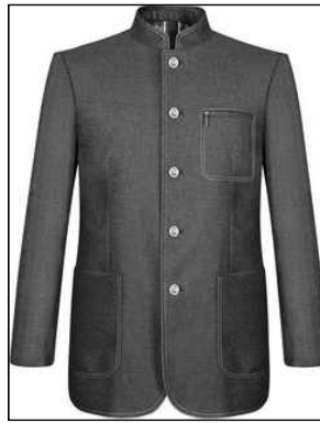
<Fig. 19> Standing Band Collar Mao Suit (goo.gl/vzfywC, n.d)