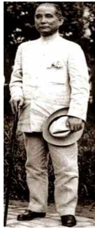
〈Fig. 4〉 Sun Wen, 1921 (ycwb.com, 2011)

바뀌었고 원래 3개였던 인사이드 플랩 포켓(inside flap pocket)을 수정하여 위·아래로 총 4개의 아웃사이드 플랩 포켓(outside flap pocket)을 부착하였으며 두 장 소매에 전체적으로 뾰뚱한 와이셔츠를 입은 것처럼 딱딱한 디자인으로 변형되었다 〈Fig. 5〉. 더불어 바지는 단추로 여미고 양 옆에는 큼지막한 인사이드 포켓을, 허리춤에는 작은 시계 포켓을 만들고 오른쪽 엉덩이에 덮개가 있는 인사이드 포켓을 하나 더 추가하여 덮개를 달아 마무리하였다(Hwa & Kim, 2008). 이 시기의 중산복