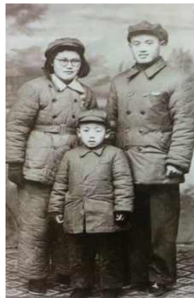
<Fig. 12> Lenin Suit, 1950s (Zhang & Cao, 2012, p. 330)