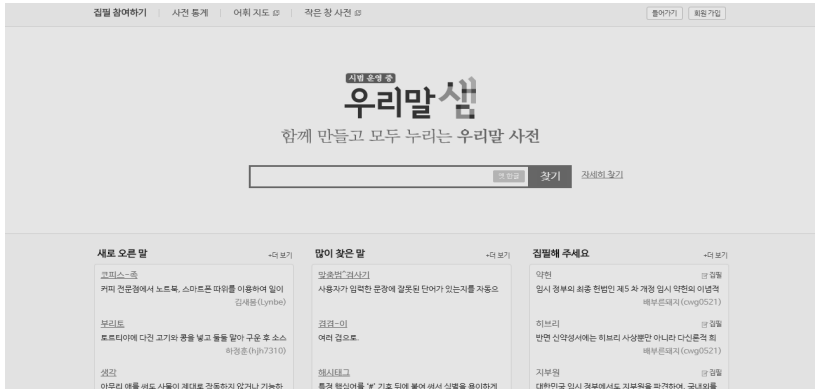
〈그림 1〉 우리말샘 홈페이지 화면(검색일: 2016.11.28. http://opendict.korean.go.kr/ )

신조어에 대한 개념 정의와 용례뿐만 아니라 다양한 정보를 제공하기 위하여 내용의 구성을 분류하고 있다. 첫째, 비슷한말, 반대말, 참고 어휘, 다의어, 상위어, 하위어 등의 관련 어휘에 대한 관계를 정리해 보여주고 있다. 둘째, 시기별로 형태나 의미가 변하는 어휘의 변천 과정에 대한 정보를 제공하고 있다. 셋째, 사진·동영상 등의 멀티미디어 자료를 제공하고 있다.