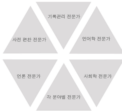
〈그림 3〉 자문 위원회 구성

신조어 아카이빙이 국민들에게 신뢰있는 정보를 제공하고, 사회 현상을 분석하기 위한 전문성 있는 연구 자료로 활용되기 위해서는 각 분야별 전문가들로 구성된 자문 위원회의 견해가 뒷받침되어야 한다. 사회 각 분야에서 신조어가 나타나기 때문에 그 범위와 영향을 이해하기 위한 각 분야별 전문가들의 지식과 가치가 반영되어야 할 것이다. 따라서 자문위원회는 기록관리 전문가, 사전 편찬 전문가, 언론 전문가, 언어학 전문가, 사회학 전문가, 각 분야별 전문가를 비롯하여 각 분야별 전문가들로 구성되어야 한다.