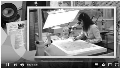
How We Serve Canadians : For the Record