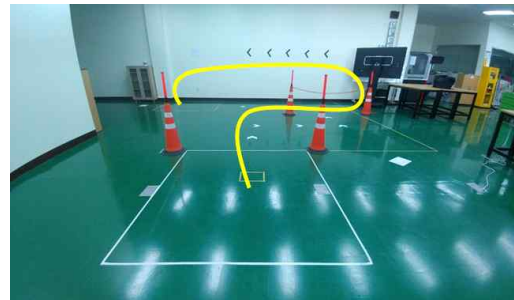
(b) Changed experimental environment