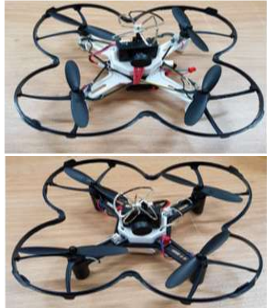
Fig. 4 A motion-based drone (above) and a joystick drone (below)

Acid)를 사용했다. 출력 시 무게감을 다르게 출력하여 실험하였다. 출력은 조밀할수록 안정감은 있으나 출력물의 무게가 늘어나 사용자가 오랜 조종 시 피로감을 느낄 수 있는 점을 감안하였다. 구성품은 Table 2와 같다. 부품을 배치, 고정하기 위해 설계된 내부 리브의 경우 소재의 특성을 고려해 두께를 설계하여 내부를 충분히 단단하게 하였다.