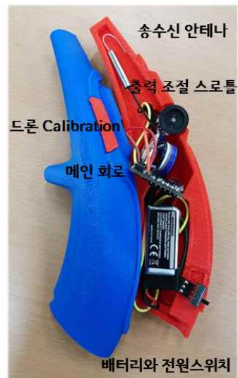
Fig. 5 The developed controller