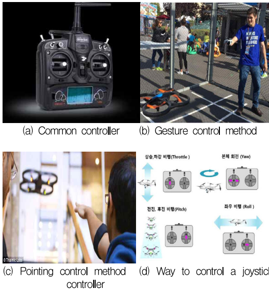
Fig. 1 Diverse methods to control drones