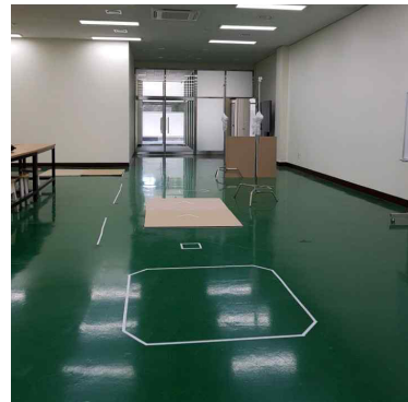
(a) Previous experiment environment

변경된 실험의 코스는 Fig.6과 같다. 작은 네모에서 드론이 출발하여 전진 후 우회전, 전진하여 장애물을 위로 통과 한 후 좌회전 비행 후 전진하여 착지하게 된다.