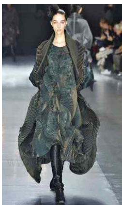
〈Fig. 4〉 2016 F/W Issey Miyake (firstview, n.d-a)