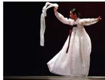
<Fig. 3> Exorcism Dance [Salpurichum] (naver, n, d-c)