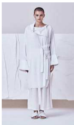
<Fig. 9> 2017 S/S Soulpot Studio (soulpotstudio, n.d-b)