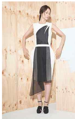
<Fig. 14> 2016 S/S Soulpot Studio (soulpotstudio, n.d-d)