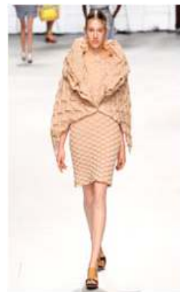
<Fig. 15> 2015 S/S Issey Miyake (fisrtview, n.d-f)