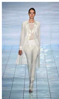
<Fig. 10> 2015 S/S LIE SANGBONG (fisrtview, n.d-c)