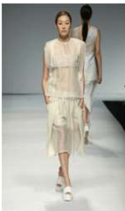
<Fig. 12> 2015 S/S SoulPot Studio (soulpotstudio, n.d-c)

현대 패션에 나타난 정중동의 표현 중 조화에 의한 상호 관계적 표현은 정중동의 특성인 유희적 상호 관계적 표현과 같이 착용자와 관찰자에 의해 가지게 되는 내재적 의미는 다를 수 있으나, 서로 상호 교류할 수 있는 형태적 표현으로 차용되어 나타남으로써 정중동의 성격 중 중의 성격인 중용