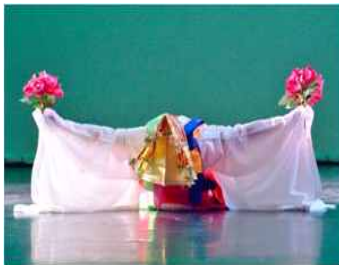
<Fig. 1> Butterfly Dance [Nabichum] (naver, n, d-a)

자연미의 추구를 최우선으로 지향하는 한국춤은 무용수의 연륜을 통해 흥(興)과 신명(神明),