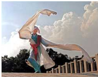
<Fig. 2> Buddhist Dance [Seungmu] (naver, n, d-b)