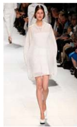
<Fig. 11> 2015 S/S Issey Miyake (fisrtview, n.d-d)