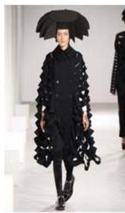
〈Fig. 6〉 2015 F/W Junya Watanabe (firstview, n.d-b)