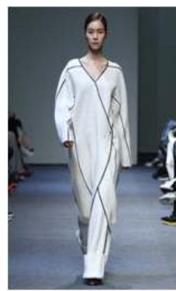
〈Fig. 7〉 2015 F/W Low Classic (lowclassic, n.d-a)