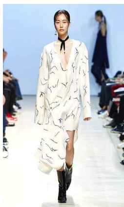
<Fig. 8> 2016 S/S Low Classic (lowclassic, n.d-b)

정중동의 마지막 특성인 창작자와 관람자 사이의 상호 교류를 통해 나타나는 유희적 상호 관계성은 현대 패션에서 색채와 소재의 대비의 조화를