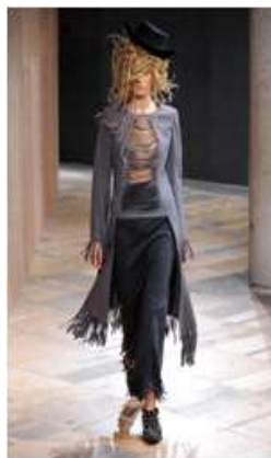
<Fig. 13> 2014 S/S Junya Watanabe (fisrtview, n.d-e)