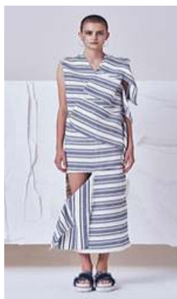
〈Fig. 5〉 2017 S/S Soulpot Studio (soulpotstudio, n.d-a)