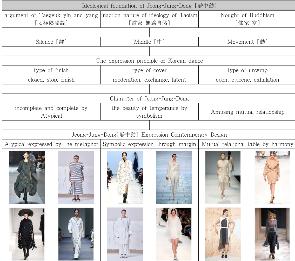
<Table 2> The Jeong-Jung-Dong[Movement in Silence] Expression Comtemporary Design