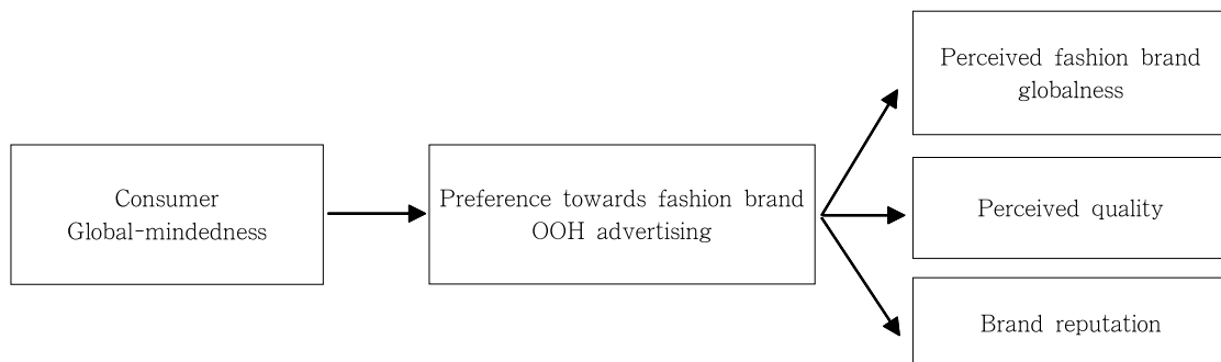
<Fig. 1> Research Model

지각된 패션 브랜드의 글로벌성은 브랜드가 여러 국가에서 판매 활동을 하고 있고 일반적으로 글로벌하다고 인식되어 있음을 소비자들이 믿고