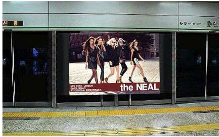
<Fig. 2> Priming image

AMOS 7.0 프로그램을 사용하여 추출된 요인들의 타당성을 검증하기 위한 확인적 요인분석을 실시하고 가설모델 검증 및 모델의 적합도를 측정하기 위하여 구조방정식모형 분석을 실시하였다.