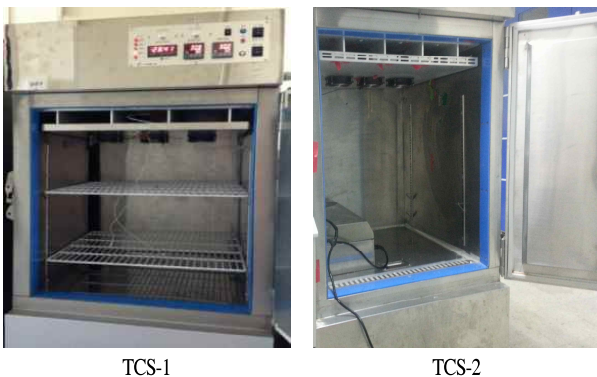
Fig. 1. Transportable thermoelectric cooling system.

VBN 측정은 Conway 법을 이용한 미량화산법(10)에 준해 측정하였다. 시료 5 g에 증류수로 50 mL까지 부피를 맞춰준 후 homogenizer(T25, Janken & Kunkel, Staufen, Germany)로 균질화 한 다음 여과지(Whatman No. 1)로 여과한다. 여과액 1 mL을 conway dish 외실 왼쪽에 넣고 내실엔 1 mL의 0.005 mol-H 2 SO 4 을 넣은 후 외실 오른쪽에 포화용액 K 2 CO 3 용액 1 mL을 넣는다. 여과액과 K 2 CO 3 용액을 잘 섞은 다음 25°C에서 60분간 반응 시킨다. 반응 후 내실에 Brunswik 시약으로 발색시킨 후 0.01 N NaOH로 적정하였다.