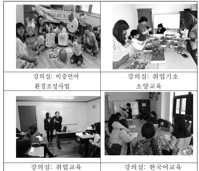
Fig. 2. Use of GJ facility

다. 본 시설의 평면상의 특징으로는 <Fig 1> □ 자 형태에서 중심 ( ) 가