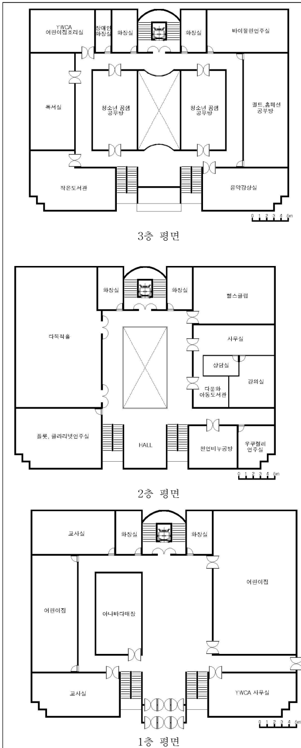
Fig. 1. Floor plan of GJ facility

다. 본 시설의 평면상의 특징으로는 <Fig 1> □ 자 형태에서 중심 ( ) 가