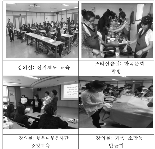
Fig. 4. Use of CJ facility

비스를 이용할 수 있다는 장점이 있는 반면에 복합시설에서와 같은 지역 일반 주민들과의 교류나 소통을 같이 할 수 없는 단점이 있다. 특히, 본 시설의 경우 2,3층은 이용사례를 <Fig 4>에 나타내듯이 교육중심의 공간으로 구성되어 있다. 전체적으로 편측부분에 통로와 계단실이 설치되어 있어서 지원센터 이용자들이 여유시간에 교류와 소통을 하기 위한 공간은 1층 홀 부분이 유일한 장소이다. 이용자들의 자유로운 이용을 전제로 한 다소 여유 있는 공용공간을 확보하는 것이 지원센터 이용자들의 소