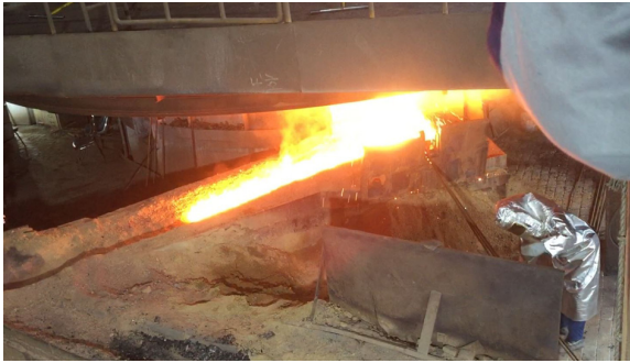
(a) Drilling(No.1 electric furnace)