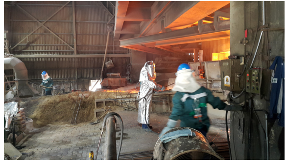
(b) Drilling(No.2 electric furnace)