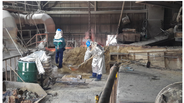
(d) Masato embrocation in runner