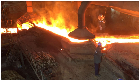
(c) Slag separation and sosuckwhoi embrocation