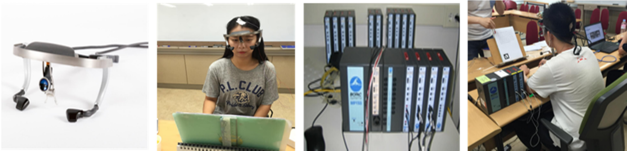
Figure 1. Device and experimental scene