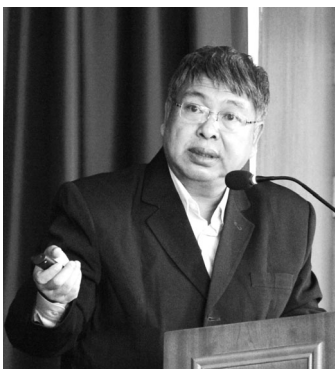
▲ 미얀마 농림부 농기계국 SOE SOE 과장

미얀마는 틸 쉐(Htin Kyaw) 대통령의 문민정부 출범에 따라 서방국가들의 경제제재 조치가 점차 완화될 것으로 기대되고 있으며, 미국 정부는 최근 미얀마 '투자 사업단'을 모집하고 있다.