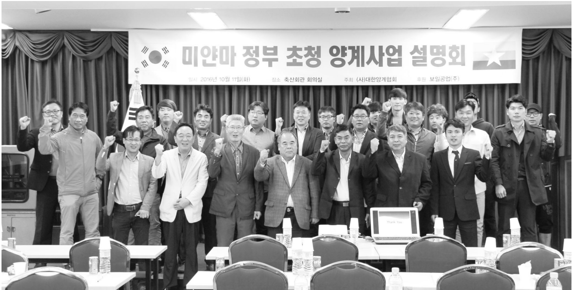
▲ 설명회 참석자 단체 사진

미얀마 소비자들은 한류에 대해 매우 친숙하게 여기고 공중파 TV를 통해서 항상 한국 드라마·K-POP을 시청하는 등 호의적인 태도를 보이고 있다.