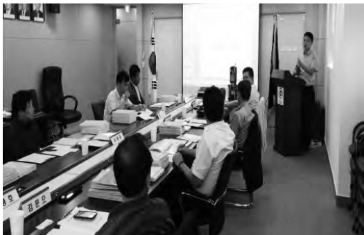
방재신기술지정 평가위원회 질의응답

(유)한성산기의 방재신기술은 국민안전처(장관 박인용)로부터 3년간의 보호기간 설정과 함께 신기술 지정서를 교부를 받았다.