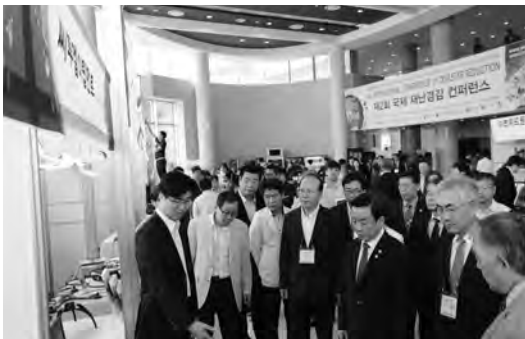
방재기술 전시관 관람

이어진 초청강연은 “국민안전처 재난안전 정책방향”이라는 주제로 박인용 국민안전처 장관의 강연이 진행되었으며, 이번 컨퍼런스는 ‘재난사례 및 재난정보 활용방안’, ‘재난피해 감소화 추진방안’, ‘기후변화와 재난’이라는 3개 세션의 주제를 가지고 12명의 세계 전문가가 주제발표를 하고 100여편의 국제논문이 발표되었으며, 13개 국가 100여명의 해외전문가와 600여명이 참여하였다.