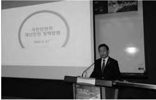
초청강연_ 박인용 국민안전처장관