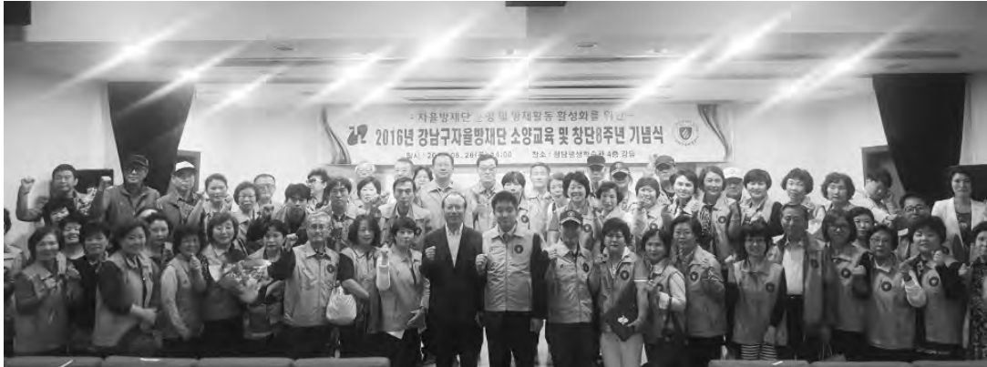
강남구 자율방재단원과 기념촬영