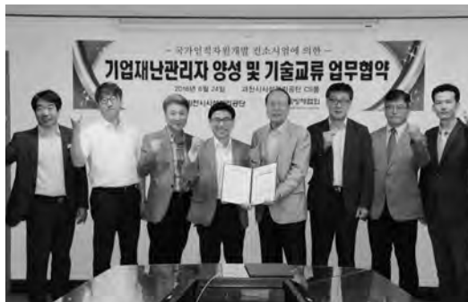
한국방재협회-과천시시설관리공단 업무협약식 단체사진