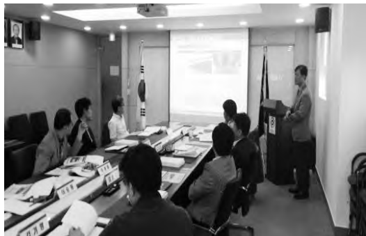
(주)효명이씨에스, 현대제철(주) 방재신기술 보호기간연장 평가위원회