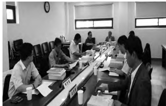
방재신기술지정 평가위원회 의결