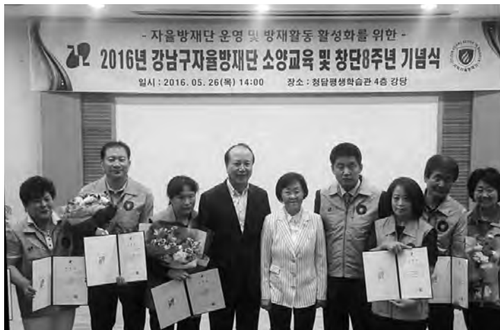
강남구 모범자율방재단원과 기념촬영. 김진영 회장과 신연희 강남구청장

강남구 신연희 구청장은 기념식 인사말씀에서 방재의 날(5월 25일) 행사 주관 등으로 바쁘신 중에도 강남구 자율방재단 소양교육에 특강을 위해 시간을 내주신 김진영 회장에게 감사의 말씀을 전하였고 모범방재단원들에게 표창장을 수여하였다.