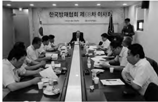
제68차 이사회 사진