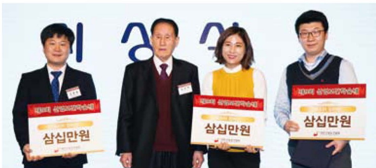
포스터 부문 장려상수상자들