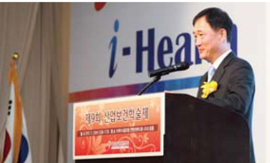
고용노동부 박희진 국장