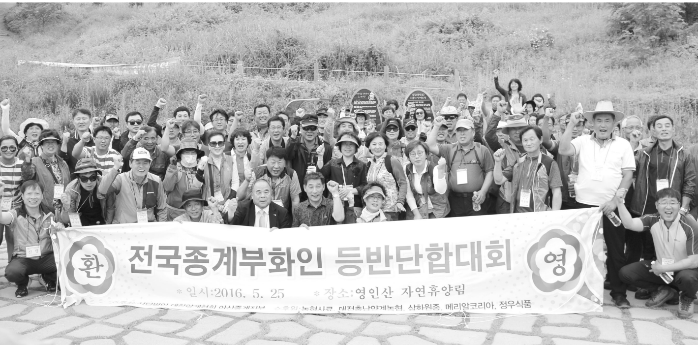
▲ 영인산 등반에 앞서 파이팅을 외치고 있는 전국 종계부화인들