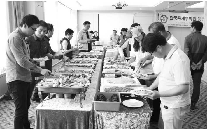
▲ 오찬 시간 중계부화지부 회원간 단합과 업계현안사항에 대해 토론이 있었다.