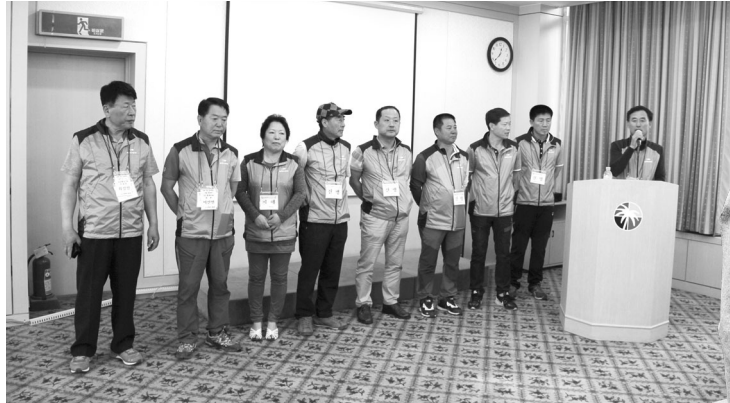
▲ 2016 전국 중계부화인 등반단합대회 행사 진행을 맡은 아산중계지부 회원들